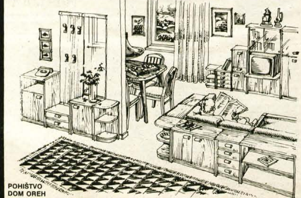
POHIŠTVO DOM OREH

OB ŠKOFJELOŠKEM OBČINSKEM PRAZNIKU ČESTITAMO OBČANOM IN JIM ŽELIMO USPEŠNO IN SREČNO LETO 1989!