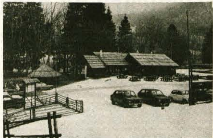
Turizem ob jezeru - Takole (živahno) je letošnje zimo, čeprav ni snega, domala vsak dan, posebej pa ob koncu tedna ob Planškem jezeru na Jezerskem.