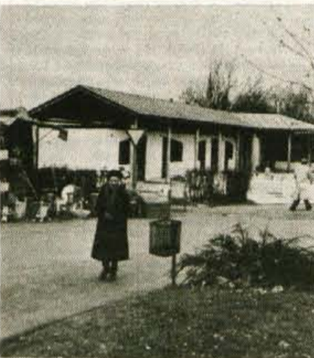
Prihodnji mesec bo zgrajena in odprta tržnica, uredili pa bodo tudi parkirišče...