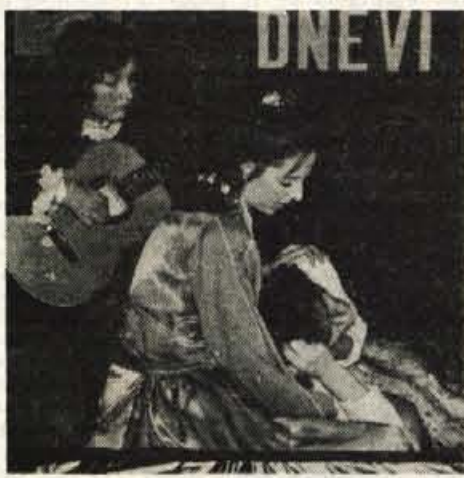
Mladi gledališčniki — Dramska skupina iz Boh. Bele je zaigrala še neuprizorjeno Linhartovo enodejanko.

Po njegovi zaslugi se kraj uspešno povezuje s kulturnim društvom, ta povezanost pa omogoča stalno pomlajevanje društva. S svojimi izkušnjami in sposobnostmi se vsa leta vključuje tudi v delo ZKO Radovljica.