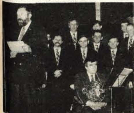
Radovljica — Na podelitvi Linhartovih priznanj je pel združeni pevski zbor Kropa-Podnart.

Čprav bi bilo krivično in tudi resnici ne bi ustrezalo, da je vsakokratna radovljiška proslava Linhartu v spomin pomembna prav glede izbora govornika na proslavi. Res pa je, da se je dr. Dimitrij Rupel, slovenski književnik, ki so ga tokrat radovljičani povabili, da nekaj spregovori o njihovem slavem rojaku Linhartu, izjemno potrudil in natresel vrsto dejstev in podatkov o Linhartu, ki so daleč presejali povprečno vedenje o našem prvem slovenskem dramatikcu. Celotno več, Rupel je Linhartu pridal poleg splošno priznanega dramskega prvenstva še druge vrline, ki jih ni najti ravno v vsakem