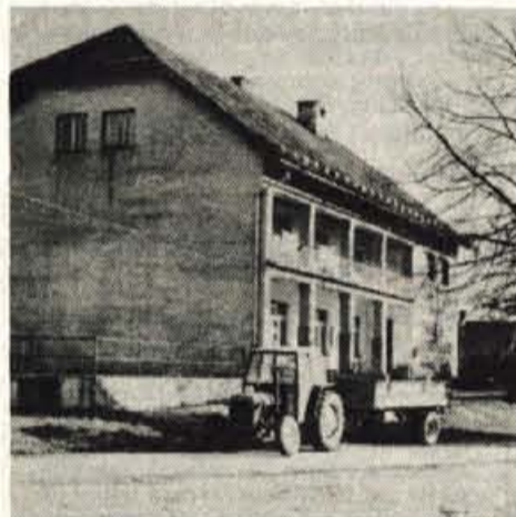
Zdaj jih iz referendumskega programa čaka še najtežji zalogaj: obnova doma in ureditev trgovine v njem...