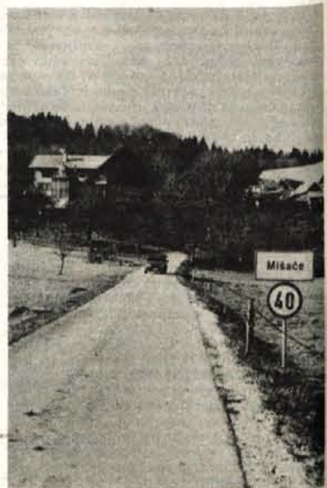
Letos so uredili tudi cestno povezavo od Mišac proti Otočam...