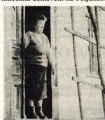
Poljane, 11. decembra - Vseskozi so nas v šolah učili, da je bil pisatelj Ivan Tavčar doma iz uglednega dvorca na Visokem. V resnici pa je dvorec šele sam kupil, rodil pa se je pri Kosmu v Poljanah, v hiši, ki je bila tedaj s slamo krita.