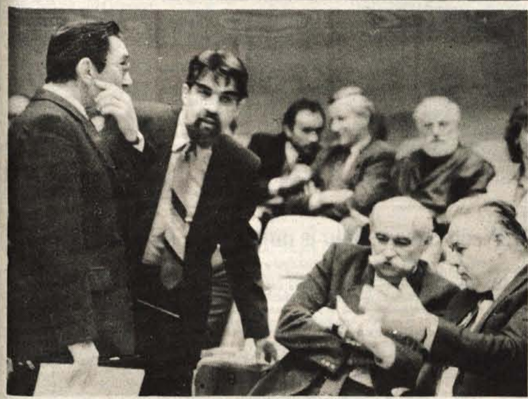
Pred začetkom zбора kulturnih delavcev

70 ljubljanska banka Temeljna banka Gorenjske Kranj Gorenjc in banka — formula prihranka