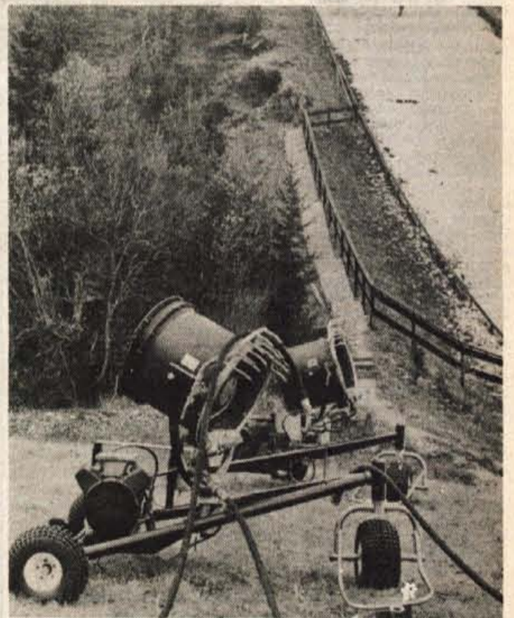
Planica, 15. novembra - Organizacijskemu komiteju Planice je uspelo, da so za trening s tremi snežnimi topovi usposobili 90-metrsko skakalnico. Na skakalnici trenirajo naši smučarski skakalci ter skakalci iz Avstrije in Zahodne Nemčije. (dh)