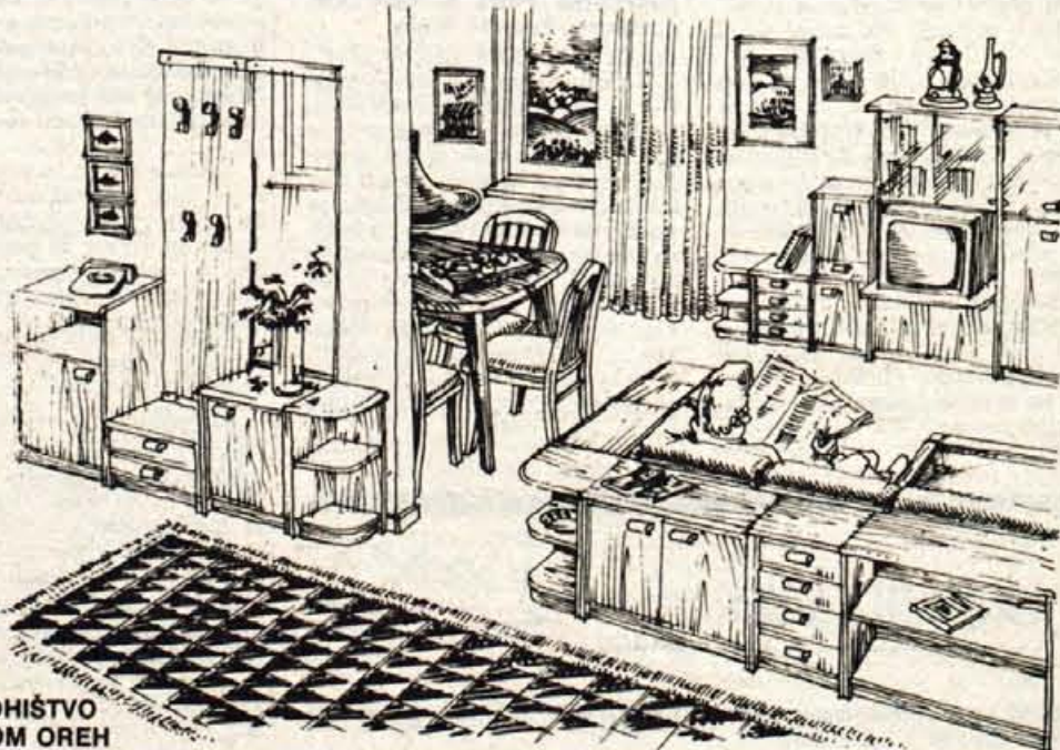
POHIŠTVO DOM OREH