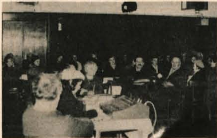
Ustanovnega zbora društva se je v četrtek udeležilo blizu 200 čla-