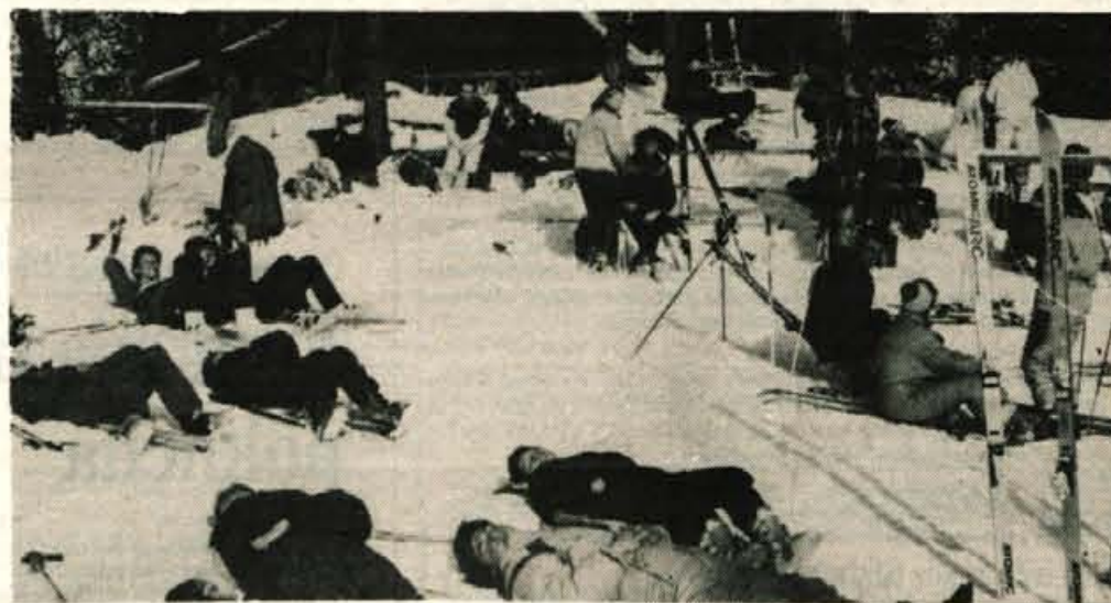
Medtem ko se večina šolarjev drži lepo doma, je najbolj vnete smučarje lepa nedelja zvalila na smučišča. Takole so lovili barvo na Krvavcu.

Prav je, da jim med počitnicami ponudimo zabavo, sprostitve, rekreacijo (zakaj samo med zimskimi štirinajstimi dnevi?!). A ne delajmo iz tega cirkusa, ne silimo otrok v počitnice po naši meri, pustimo jim, da si jih sami ukroje; če v postelji, pa v postelji. In če smo že tako prekleto (licemersko) zaskrbljeni za našo mladež, ostanimo kakšen dan z njimi doma, igrjamo, pogovarjamo se, povabimo jih na sprehod, v picerijo. Dejali bodo, da tako lepih počitnic še ni bilo... H. Jelovčan