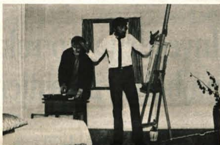
Uspešna dramska skupina — V eni zadnjih sezon so igrali Partljičovo igro Tolmum in kamen