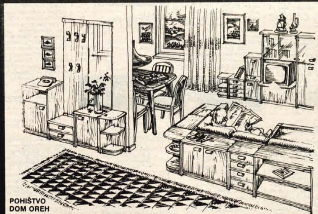
POHIŠTVO DOM OREH