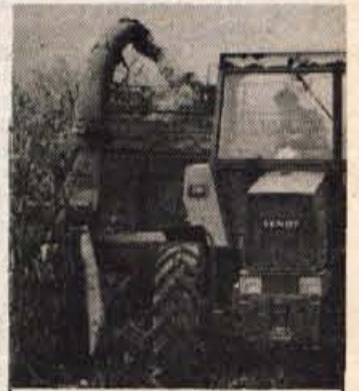
Jesen je tu — Ne le vremenska, tudi koledarska jesen se je v sredo začela. Kmetje lepo vreme izkoriščajo za spravilo zadnjih poljščin in silažne koruze.

kvalitetna turistična ponudba pa vse skupaj ni pomenilo nič — ali kvečjemu le malo. Take filme smo imeli ničkolikokrat priložnost primerjati na mednarodnem festivalu športnih in turističnih filmov v Kranju. V pričakovanju nedomiselnosti filmskih ustvarjalcev, producentov in naročnikov, ki bi sicer radi prodali lepote, pa ne vedo kako, pa tokratni program turističnih filmov z različnih koncev sveta obeta vse kaj drugega. Odkrita je »nova« formula — na zanimiv in privlačen način predstavljena kultura neke dežele. Ta nova propaganda, kajti turistični film je konec koncev vendarle le reklama, je očitno v svetu stopila velik korak naprej, se povzpela na višji, lahko bi rekli kulturnejši nivo — in ostala zanimiva bolj kot kdajkoli prej. To pa očitno ne drži tudi za naš slovenski in tudi jugoslovanski turistični film. Na žalost se še drži klasične modrine morja in ostalih, menda preskušanih atributov dobre turistične propagande. Priložnosti, da se vidi, kako ta posej obvladajo drugod po svetu, bo naslednji teden v festivalnem kinu Center pač na pretek. Lea Mencinger