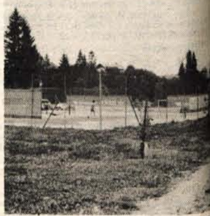
Celo prej kot v letu dni so v športnem parku zgradili dve teniški igrišči. Opravili so 13 prostovoljnih delovnih ur.

Pravijo, da bo v športnem parku kmalu stala tudi brunarica z manjšim bifejem in da bodo z urejanjem zdaj nadaljevali. Najprej nameravajo zgraditi še večnamensko igrišče in balinišče, pozimi pa urediti tekaške proge... Neke vrste zagotovilo, da bodo takšen načrt hitro izpeljali, je najbrž tudi, da je ponudbo za skrb in upravljanje parka