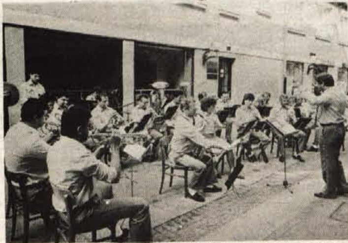
Pozornost je s svojim programom vzbudil tudi tržički pihalni orkester.