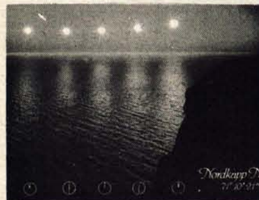
Polnočno sonce - videla sva ga samo na razglednici

V bližini je tudi znana lončarna, kjer sedaj že četrti rod nadaljuje družinsko tradicijo. Ilovico za izdelavo raznih skled in vaz sedaj uvažajo iz Nizozemske. Oglekamo si tudi zanimiv potek izdelave vaze. Reko Atran prečkamo preko mostu, ki je bil zgrajen leta 1754 in je najstarejši most na Švedskem. Po Doktorjevem drevedredu gremo proti rečnemu toku in ob vodi vidimo veliko ribičev, ki z obilo sreče poizkušajo ujeti zelo cenjeno ribo salmon. Prispemo do tako imenovanih Salmonovih stopnic. To so stopnice, po katerih teče voda, da