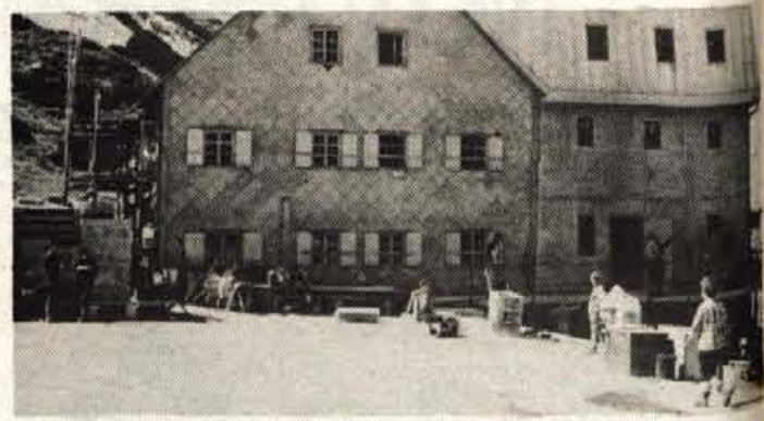
Posodobljena Cojzova koč na Kokrškem sedlu bo kmalu nared.