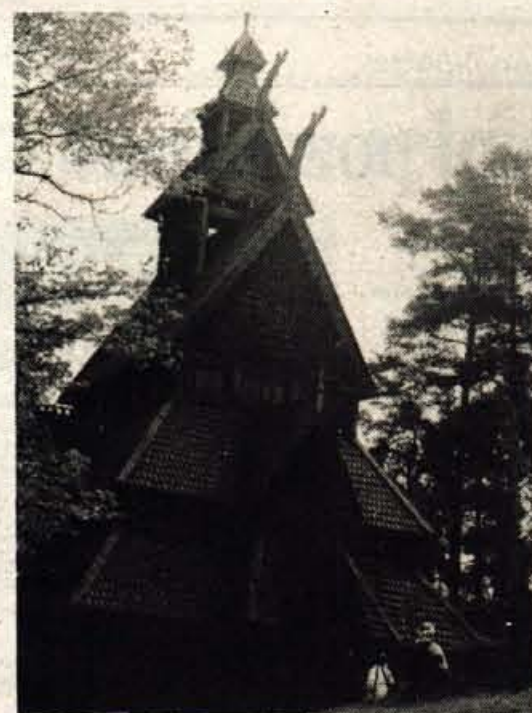
Cerkev iz 12. stol., v celoti lesena

lahko ribe pridejo mimo jezua na višji nivo vode. Števec rib kaže že 52000 prehodov. Kar lepa številka, kajne. Zavijemo tudi v luksuzno gostišče. Pri belem konju, kjer je prava paša za oči umeten konj v naravni velikosti, ki stoji na veliki podkvi in se obesa sredi avle vrta okoli.