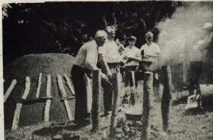
Veliko občudovanja na prireditvi je požel oglar, ki je skuhal koruzne žgance in kavo kar v kotličku ob oglarski hiši.

da se tri kmetije tu v okolici ponovno ukvarjajo u oglarjenjem: pri Podmlačanu, Črncu in Jelarju. Pravi Niko Rant. Prikaz dela oglarjev, koparskega orodja, bajte pa tudi družabna tekmovanja v žaganju in