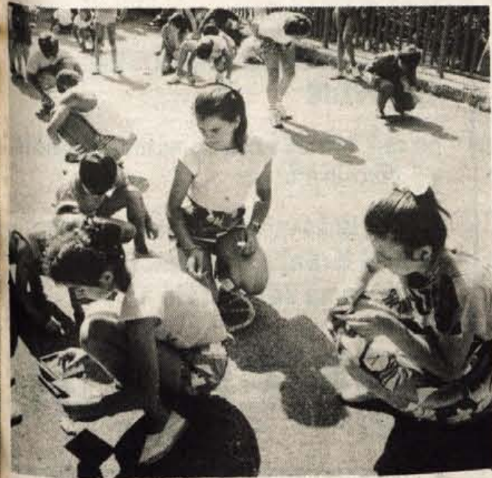
Otroška domišljija ne pozna meja.