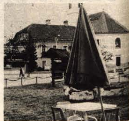
Šenčur se je tako razširil, da ni več nobenih možnosti za normalne telefonske zveze

ska na podlagi prispevka,« pravi Janez Podlogar.