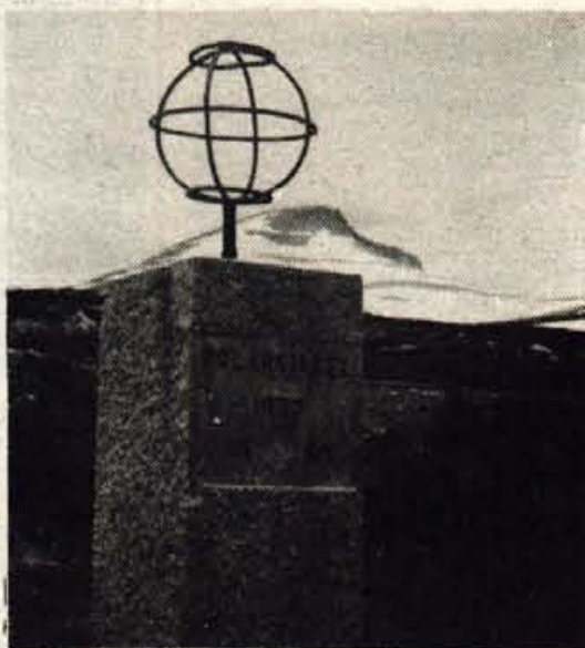
Še drugič prečiva polarni krog (66°33'N)

lahko ribe pridejo mimo jezua na višji nivo vode. Števec rib kaže že 52000 prehodov. Kar lepa številka, kajne. Zavijemo tudi v luksuzno gostišče. Pri belem konju, kjer je prava paša za oči umeten konj v naravni velikosti, ki stoji na veliki podkvi in se obesa sredi avle vrta okoli.