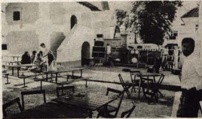
Veselica se lahko prične.