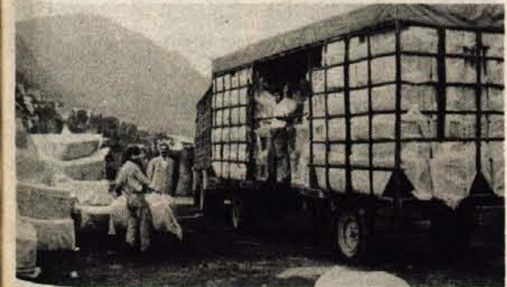
Štirideset let je na Jesenicah Izolirka proizvajala mineralno volno.