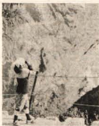
Pogled na Babe, tik ob meji z Avstrijo.