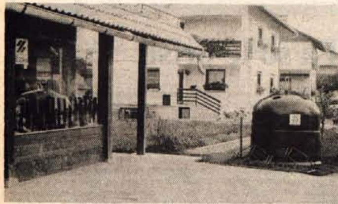
Surovina je razširila mrežo