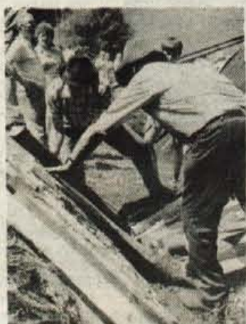
Priprava kope za kuho je svojevrstna umetnost, ki jo v gozdnih okolih Starega vrha še vedno poznajo.

»Na tem koncu je to največja pridobitev in vsako leto se zbere veliko obiskovalcev. S prireditvijo je veliko dela, vendar pa nam daje moč za sedemnajst uspešnih dnevov oglarjev, le dvakrat je malce ponagajal dež. Kar pa je še posebno spodbudno pa je to,