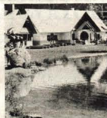
Ob čistejši Jasni je spet živahnije.

Kaže, da mora biti sto sestankov in javnih opozoril, da se v Kranjski gori vsaj nekaj premakne: spomnimo se samo nesrečnega mostu preko Pišnice, ki že nekaj časa jezi turistične delavce in gostince na Vrščici in v Trenti. In tudi pri jezeru Jasna se je »premaknilo« domala na