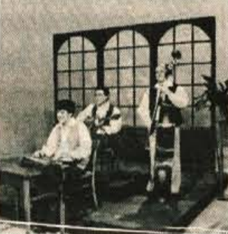
Ansambel Mihe Dovžana