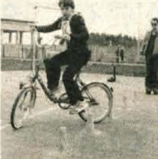
Spretnostna vožnja je najzanimivejši del prometnih tekmovanj mladih.