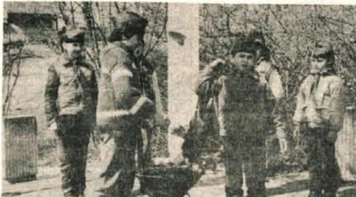
Zati log v Seiški dolini v petek opoldne: davški pionirji predajo torbico soriškim.