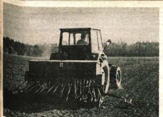
Setev se začne — Setev se začne tudi na gorenjskih poljih. Zadnje dni sicer nagaja vreme, vendar bo kljub temu časa za pomladanska opravila na polju še vedno dovolj. Pravijo, da je semen in zaščitnih sredstev ter gnojil dovolj, vendar je nakup teh sredstev vedno dražji in boleč za kmetov žep.