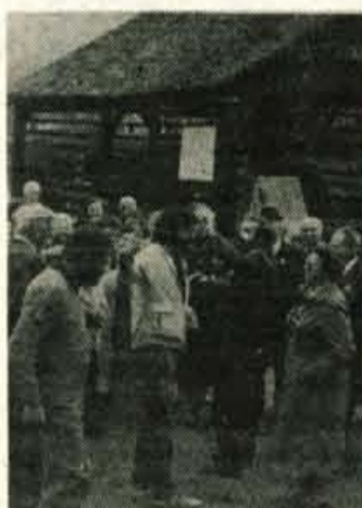
Na izletu z najstarejšimi naročniki