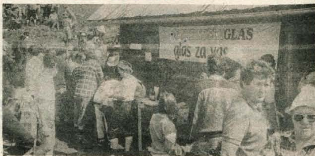
Z Gorenjskim glasom na Veliki Polani-