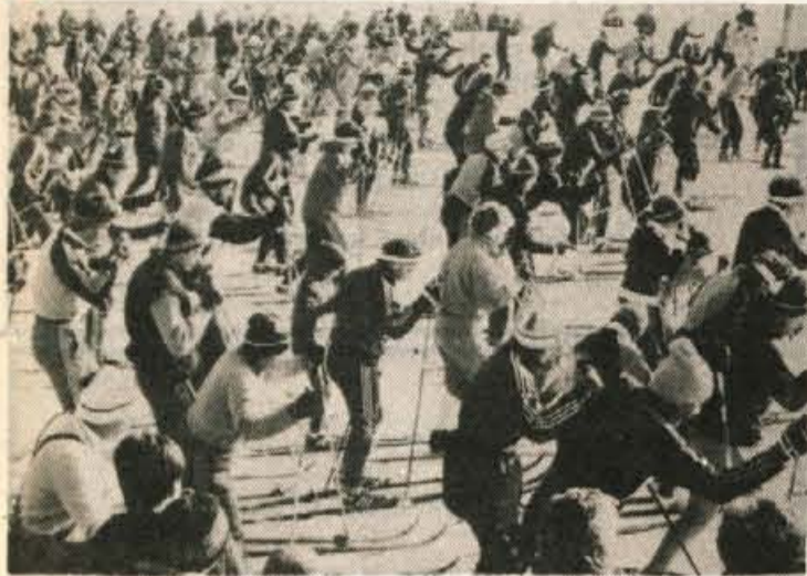
Start tekačev in tekačic v kategoriji rekreativcev.

Cerklje, 1. februarja — Smučarski delavci športnega društva Krvavec iz Cerkelj so v nedeljo odlično organizirali že sedmi množični smučarski tek Gorenjskega odreda. Pod pokroviteljstvom Iskre Delte je na množičnem smučarskem teku v smučini pod Krvavcem nastopilo tisoč tekačev in tekačic v vseh kategorijah, od pionirjev do veteranov. V izredno lepem in hladnem vremenu so bile vse proge dobro pripravljene, saj so vzdžale vse nastopajoče. V šestih kategorijah so imeli tekmovalci in tekmovalke 10 in 25 kilometrov dolgi smučini. Tekli so tudi borci Gorenjskega odreda in drugih domicilnih enot.