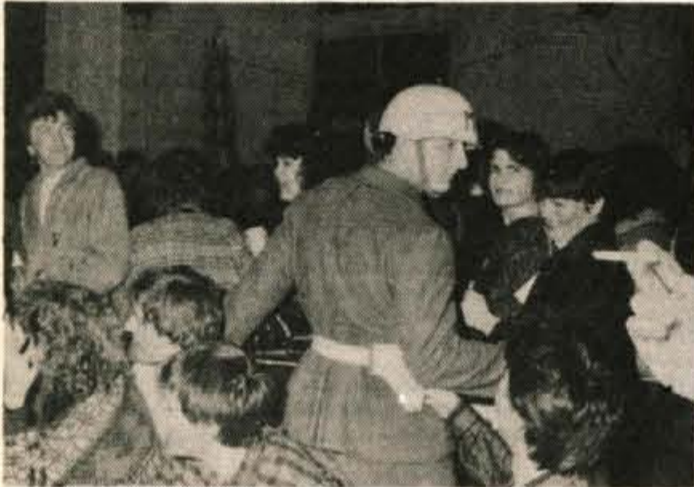
Brucovanje kranjskih študentov