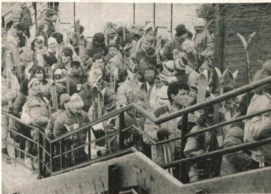
Minuli konec tedna je bila na vseh gorenjskih smučiščih velika gneča. Medtem ko je bilo v nižini mrz, živo srebro je bilo tudi prek dneva pod ničlo, je bilo na višje ležečih smučiščih precej topleje. — Na sliki: gneča na spodnji postaji žičnice na Krvavec.