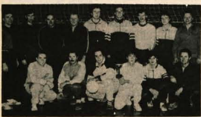
Odbojkarji Predoslja pred začetkom letošnjega turnirja: starejša in mlajša ekipa.

V Predosljah je običaj organizacija odbojkaških turnirjev. Tri pripravoje za dan mladosti, za krajevni praznik in za Dan JLA.