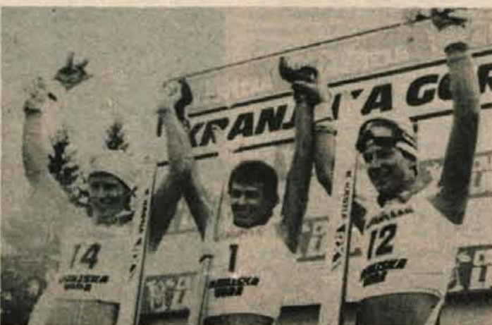
Sobotni veleslalom za točke moškega svetovnega pokala v Podkorenu je dobil Avstrijec Helmut Mayer. Drugi je bil Švicar Pirmin Zurbriggen, ki je dobil tudi pokal Vitranc, in tretji Avstrijec Hubert Strolz.

Razočaranje v taboru Italijanov in slavje Avstrijcev in seveda tudi Švicarjev v sobotni veleslalomski tekmi moških za točke v svetovnem pokalu.