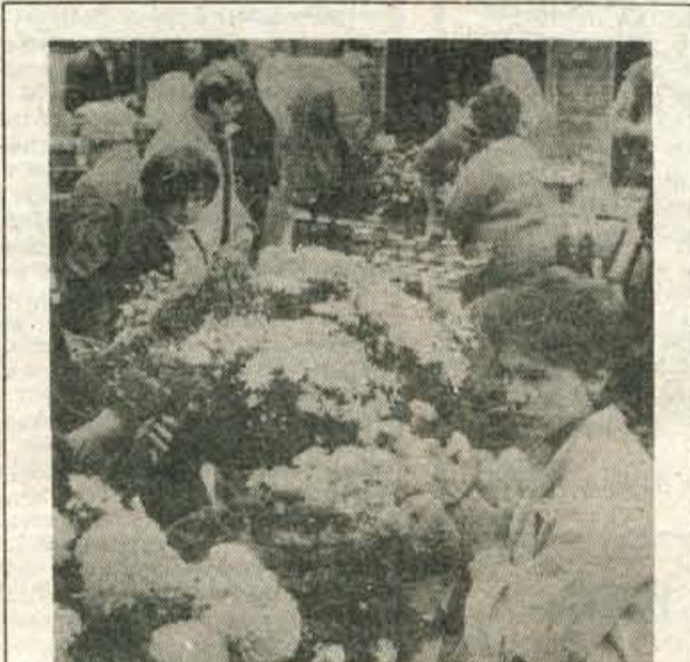
SPOMNILI SE BOMO NAJDRAJŠIH — Ob dnevu mrtvih se bomo spomnili naših najdražjih, položili šopek na grob, prižgali svečko...

Kajti to, kar se zdaj dogaja s knjigo pri nas, je vse prej kot kulturno. Koliko izide knjig, ki so vredne, da izidejo, da jih beremo, ker krepijo našo narodno bit. In če že izidejo, navadno brez družbene subvencije in v nizki nakladi. In kot tržno blago, kot čevlji, kot srajca. Izbira za kupca, ki postoji pred knjigarno z izpraznjenimi žepi potemtakem ni težka: od knjig bo bral le še naslove. Vse to, kar se zadnje čase dogaja s slovensko knjigo, je gotovo zanesljiv kažipot v zaprtost za vse smeri duhovnega življenja. Nekatere plati tega se že kažejo, druge se bodo zanesljivo še pojavile. Ni le bližina dneva mrtvih kriva za morbidno razpoloženje, ki se letova nekaterih zaskrbljenih za slovensko knjigo; toda težko se je otestiti vizije, da se utegne presihanje slovenske knjige v prihodnosti končati kar z nagrobnikom, na katerem bomo še kdaj pa kdaj prižgali svečko v žalosten spomin. L. M.