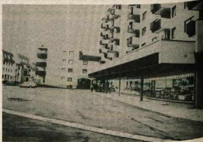
Na Planini III so letos dobili novo samopostrežno trgovino