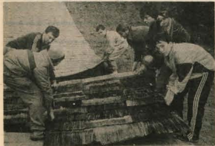
Polaganje zadnjih metrov plastike — Slike F. Perdan

Adergas, 8. oktobra — Dobro in kar daleč nese, pravijo skakalci, ki so doslej preizkušali novo plastično skakalnico v Adergasu. Slovesna otvoritev pa bo prihodnje nedeljo, 18. oktobra dopoldne, ko bo na novi napravi kakovostna mednarodna tekma smučarskih skakalcev. Kranjski skakalni klub je na tekmo povabil vse kranjske osnovne šole. Mogoče se bo prav na tej tekmi kdo od mladih odločil za skoke.