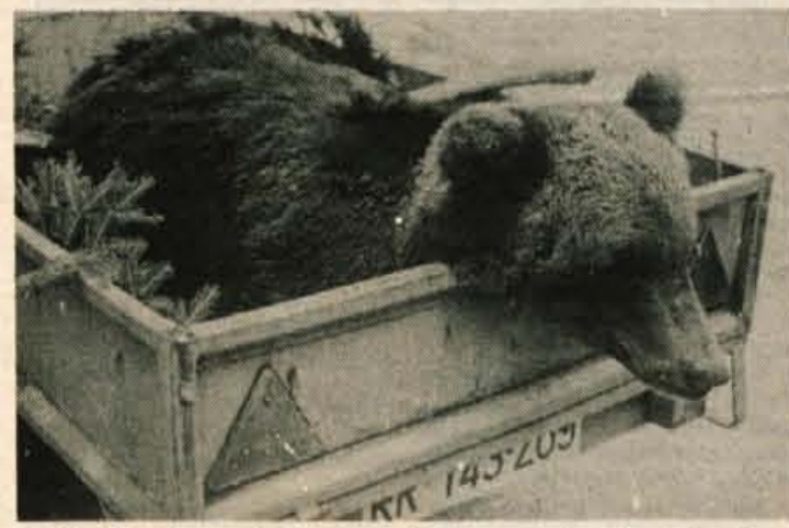
Medved je pripravljen za prevoz k preparatorju. Potem bo okras biltriške osnovne šole.

V četrtek ustreljeni medved je že pri preparatorju. Lovca sta se soglasno odločila: podarila ga bosta osnovni šoli Janeza Mencingerja v Bohinjski Bistrici. Odstrel je bil legalen, saj je imela Lovska družina Bohinjska Bistrica enega medveda v le-