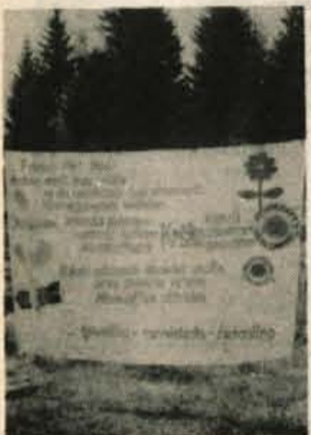
»Zeleni« za mir — Tudi na tromeji so se oglasili mirovniki in zapisali: v Avstriji ukiniti izvoz orožja, v Jugoslaviji zapreti jedrsko elektrarno v Krškem, iz Italije odstraniti atomsko orožje...

Minulo nedeljo so člani turističnih društev Rateče, Trbiž in Podklošter odlično organizirali