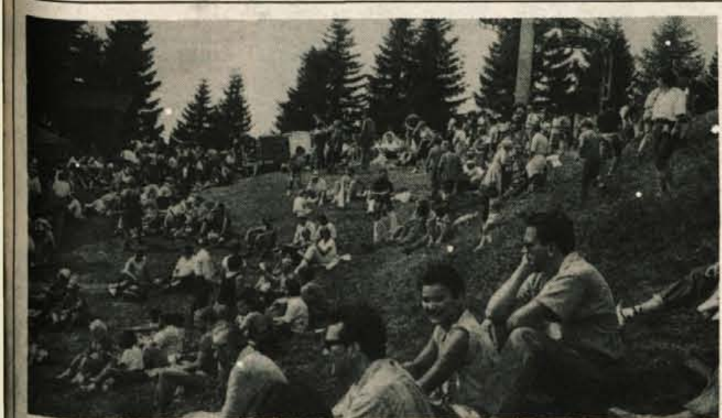
Tromeja nad Ratečami — Minulo nedeljo se je na tisoče ljudi zbralo na tromeji nad Ratečami na osmem tradicionalnem srečanju treh dežel. Vzdušje je bilo enkratno, tako kot vselej, ko se srečajo ljudje dobre volje, ki ne priznajo nobenih meja in omejitev, ki želijo živeti v prijateljstvu in dobrih sosedskih odnosih.