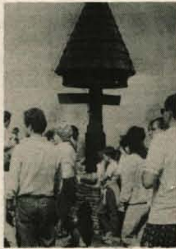
Tu, na tem prostoru, se stikajo tri dežele, trije narodi, a na srečanju so kot eno, kot da so vsi iz ene same domovine...

»To ni le srečanje ljudi, ki prebivajo ob meji. Prebivalstvo, ki tu živi, se lahko vsak dan srečuje in pogovarja; to je srečanje