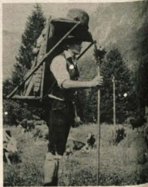
v planine, kjer je treba delati in skrbeti za živino od štirih zjutraj do noči, hkrati pa biti tudi kuhar, živinozdravnik in še marsikaj.

Bohinj, 13. septembra — Kravji bal, ki so ga v Bohinju letos pripravili že trintrideset let, je za planšarje velik praznik, saj te dni končujejo letošnjo sezono v gorah. Prav tako pa je praznik tudi za številne obiskovalce, ki se jih je v čudovitem vremenu v Ukancu, pod stenami Komarče in Pršivca, letos zbralo več kot pet tisoč. To pa je tudi dokaz in priznanje planšarjem in planšarji, ki zadnja leta spet dobiva vse večji pomen. Na petnajstih planinah v okolici se je namreč čez poletje je paslo okrog osemsto govedi in le malo manj ovac. Vedno težje pa je dobiti dobrega planšarja, saj so mladi vsi zaposleni, starejši pa ne zmorejo več vsega. Mlad kmet in planšar si namreč vedno težje zagotavlja socialno varnost in pokojninsko zavarovanje. Na pašnike odhaja le zaradi velike ljubezni do čudovitih planin in živali, saj ravninski pašniki v okolici Bohinja ne zmorejo krme za vse leto. Zato je kravji bal, ena najbolj obiskanih turističnih prireditev v Bohinju, še vedno aktualen, saj se zavedajo, da si morata turizem in planšarstvo podati roke. To vedo predvsem tisti turisti, ki se že leta vračajo v Bohinj in na okoliške planine.