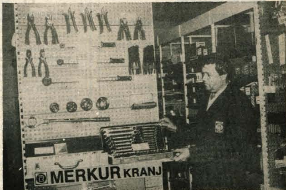
Ljubitelji kvalitetnega orodja, obrtniki, vodoinštalaterji, avtomehaniki in drugi! V MERKURJEVI prodajalni DOM Naklo v Naklem imajo veliko izbiro in ponujajo kvalitetno orodje iz uvoza proizvajalcev STAHLWILLE, PRAYER in RIDGID.