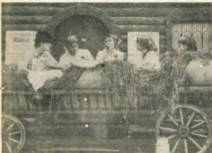
Turistični delavci v Bohinju so letos poleti pripravili številne prireditve, s katerimi so počastili osemdesetletnico organiziranega turizma. V soboto so pripravili Zoisove igre, s katerimi so prikazali življenje v Bohinju v Zoisovem času.

ustanovili Društvo za privabitev tujcev za Bohinjsko Bistrico z okolico in občino Srednja vas. Imelo je bohinjski značaj in ne le lokalnega. Že prvo leto so izdelali ilustriran prospekt v treh