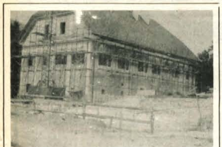
Obnova Tavčarjevega dvorca napreduje — Na Visokem v Poljanski dolini škofjeloški Alpetour obnavlja Tavčarjev dvorec. Propadanje objekta je doseglo že grozeče razsežnosti, zato so se pri Alpetouru odločili za obnovo, zaupali pa so jo Tehniku iz Škofje Loke. Obnova poteka po programu.