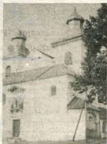
Cerkva na Joštu skriva vrsto zanimivosti