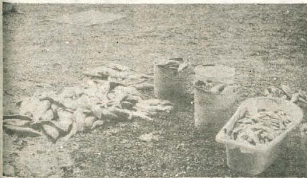
Tale kup je le desetina poginulih rib, ki so jih potegnili iz Kokre, še nekaj let pa bo reka mrtva. Skoda ocenjujejo na nekaj deset milijonov dinarjev, vzrok za pomor rib pa še raziskujejo. Bržkone bo težko s prstom pokazati na krivca, sprašujemo pa se, koliko nesreč bo še potrebnih, preden se bomo vsi osvestili, kako neusmiljeno onesnažujemo okolje.