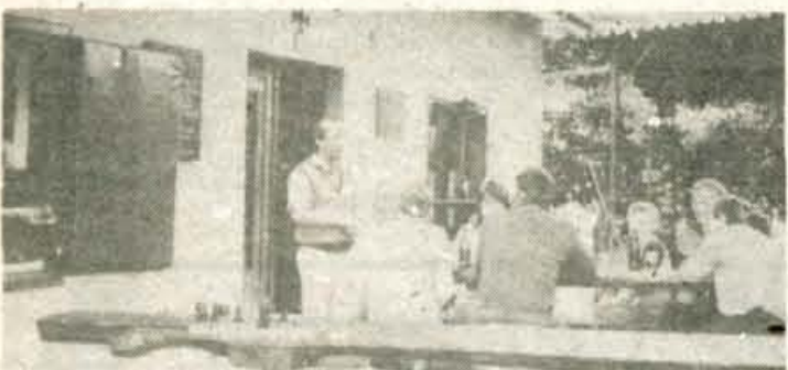
Poletni obiskovalci Jošta najraje posede zunaj, pozimi pa pri peči v domu Borisa Ručigaja, ki je dobil ime po znamenitem predvojnem športniku in padlem borcu iz Kranja.