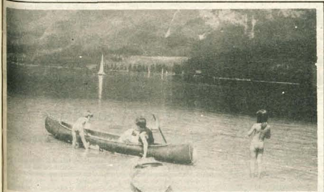
Kopanje v Bohinjskem jezeru je lahko prijetna osvežitev v vročih »pasjih dneh«.