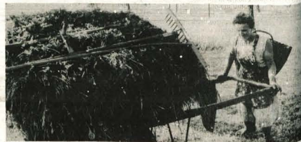
Tako vse je na vozu, gremo domov

Medtem ko je v višjih predelih, kjer so kmetje usmerjeni največ v živinorejo, v polnem razmahu košnja, pa je v nižini poleg lete najvažnejše opravilo še okopavanje (pesa, krompir...), nekateri pa še škropljenje poljščine proti škodljivcem. O morju ne razmišljajo preveč, saj niti nimajo prostega časa, pa tudi denarja je bolj malo. Torej eni delovno, na polju, drugi pa počitniško, na morju!