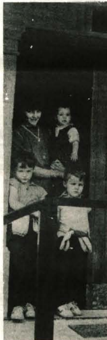
Pijača, ki se je nikoli ne naveličša, je voda; sadež, ki se ga nikoli ne naveličša, je otrok.