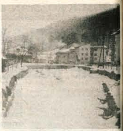
V Plamenu so obljubili, da bodo letos uredili bajer v Kropi.

deluje z delovnimi organizacijami. Nič manj z gledno ni sodelovanje s sosednjimi krajevnimi skupnostmi v dolini Lipnice. Odkar so redni sestanki vodstev delovnih organizacij in krajevnih skupnosti v dolini postali pravilo, so se že lotili nekaj skupnih programov. Uspeh pa je tudi, da so se Kroparji končno znebili očitka, češ da so tisti, ki zavirajo preskrbo s prepotrebno pitno vodo v dolini. Ob lanski suši so na hitro dodatno zajezili Kroparico in ji odvzeli 20 litrov vode na sekundo. Ugotovili so, da se ji prav nič ne pozna in da se zaradi tega ni spremenila v smrdljivi kanal. Zdej je pri odvzemu 10 litrov pitne vode dovolj. Kroparji so končno prišli do pravega podatka, Komunalno gospodarstvo Radovljica pa bo tudi lahko dokončno rešilo problem.