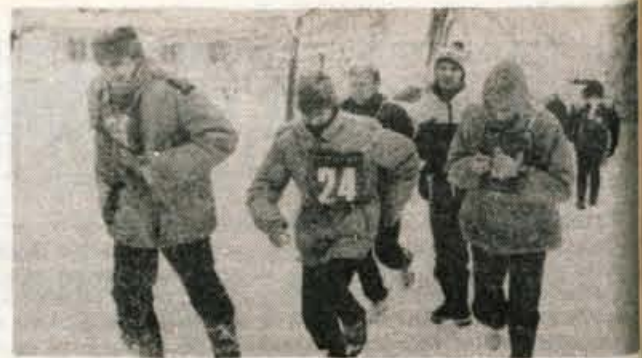
S tekmovanja ekip ZSMS in ZRVS. Na sliki ekipa Maribor pred ciljem