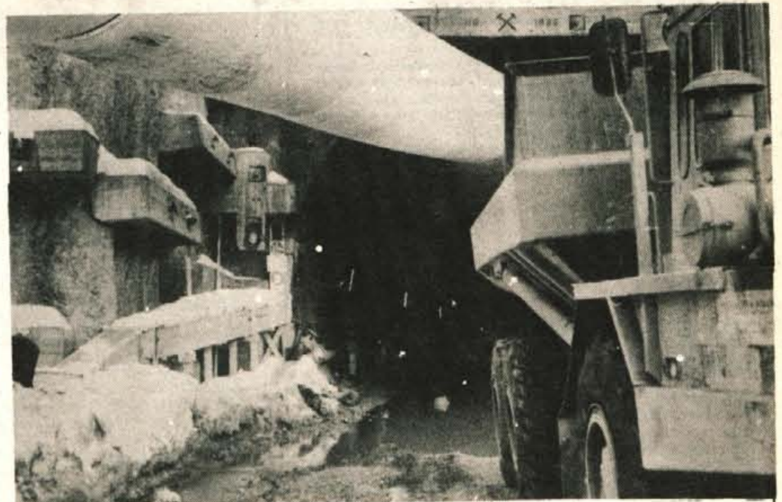
Ob koncu februarja 500 metrov vrtine — Gradnja karavanskega predora poteka po načrtih. Zdaj nimajo več toliko problemov, saj so v skalnati hribini. Še vedno pa je kar precej vode, vendar kljub temu napredujejo po šest metrov na dan. Do zdaj so delavci Slovenija ceste in Pollensky — Zöllnerja izkopali že 404 metre predora, predvidoma ob koncu februarja jih bodo že približno 500 metrov.

V Dolenji vasi že trenirajo sankalci iz Bosne in Hercegovine in iz Slovenije. Prvenstvo na naravnih sankalških progah se začne v soboto ob 8. uri. Na sporedu bosta dve vožnji. V nedeljo ob 8. uri bo start voženj enosedov in dvosedov. Prepričani smo, da bosta obe športni društvi dobra organizatorja. D. H.