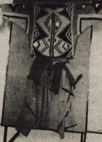
Vsak Almirin model je uspeh zase

Centra za razvoj umetne obrti v Grimščah pri Bledu. Tudi modeli, spleteni na stroj, sledijo afriškim motivom z ročnih pletilk.