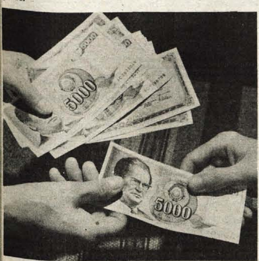
Smo lani res več zaslužili?

Osebnih dohodkov so se lani nominalno skoraj podvojili, cene na drobno pa so se povečale za 80 odstotkov. Ali torej živimo bolje kot predlani? Družine s povprečnimi osebnimi dohodki najbrž ne, saj dajo več kot polovico denarja za hrano. Osnovni živilski izdelki so se podražili precej več kot so se povečale plače.