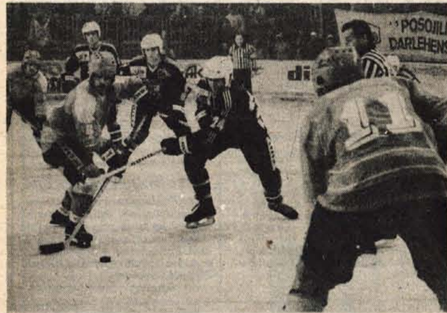
JESIČIČI ZMAGALI TUDI V KRANJU — Pred zadnjim kolom finalne skupine letošnjega državnega prvenstva v hokeju na ledu je vse jasno. Za naslov se bosta v super finalu v treh srečanjih pomerila beograjski Partizan in državni prvak Jesenice.