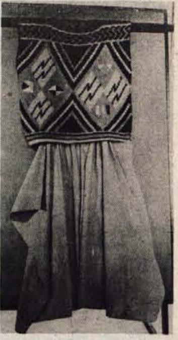
Stilizirano, atraktivno z ročnih pletilk

Na Grimšče so v ALMIRI ponosni. Ne le, da so z njihovo ureditvijo prodobili ugleden prodajni lokal in prostor za dostojno prikazovanje svojih kolekcij, tudi finančno so z njim zelo uspeli. Samo januarja letos so v Grimščah prodali petkrat več kot lani v istem času.