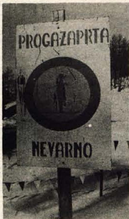
Pred vhodom v Žagarjev graben.

Kraje smučarji skorajda ne poznajo. Zmikavti se zavedajo, da bi jih z