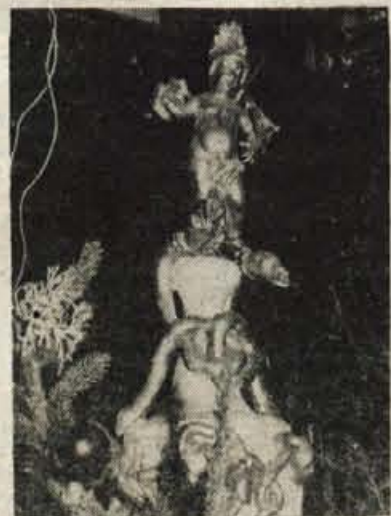
Nune so cerkev posvetile sv. Mihaelu, krotitelju hudobnega duha

Ze ustanovitelji so samostan bogato obdarovali, pozneje pa je ta še povečal svojo obširno gosposčino z nakupom posestev v sosednjih župnijah, zlasti v šenčurski (takrat je