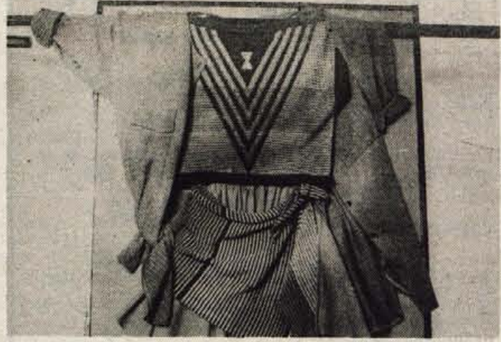
Štiri najnovejše ploske pletilne stroje, uvožene iz Zahodne Nemčije, ima Almira že postavljene v svoji pletilnici, pet jih še pričakujejo. Do konca aprila bo — če bo po sreči — vsa proizvodnja modernizirana, tako pletilnica kot konfekcioniranje.

Like so pobrale iz črnih afriških mask, iz totemov črnih plemen. Preprosto staro pletensko je zaživelo v modernejši. Barve vroče Afrike so tu. Marakeš so poimenovali svojo kolekcijo. Umirjene barve sipin in žgane zemlje oživljajo vijolične barve sončnega zahoda, ki se s črno in belo prepletajo v geometrijskih vzorcih. Iz zamolklih barv sem in