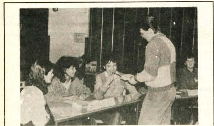
Tekmovanje klubov OZN — V petek popoldne je bilo v osnovni šoli Josip Broz-Tito v Predosljah občinsko kviz tekmovanje klubov OZN. Udeležilo se ga je šest osnovnošolskih ekip. Dve najboljši, ekipi iz osnovne šole Simona Jenka in Franceta Prešerna, se bosta januarja pomerila na gorenjskem tekmovanju (tam bo sodelovala tudi ekipa krajske srečanje šole pedagoške, računalniške in naravoslovno matematične usmeritve). Tekmovali so še učenci iz šol Bratstvo in enotnost, Stane Žagar, Josip Broz-Tito in Matija Valjavec. Ob tej priliki je bila tudi proslava, posvečena dnevu človekovih pravic.