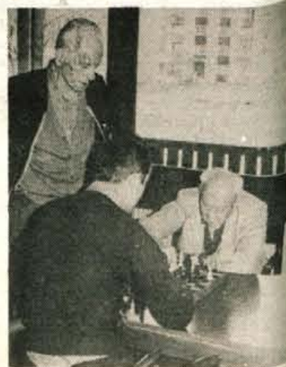
Sah - mat

store — z njimi je dom tudi dokončno urejen — in tu je dobila zdaj svoj prostor delovna terapija: zdaj sestavljajo podstavke za telefone, izdelujejo voščilnice in druge praktične stvari. Tu izdelujejo žene tudi razne malenkosti. Toda ne le žene iz doma, prihajajo tudi zunanje. Prav žene iz Bistrice so dale pobudo, da bi se tu sestajale enkrat na mesec pri ročnih delih, mentorica doma pa bi jim pomagala pri tem in onem. Oktobra so začele še s telovadbo. Dvakrat na teden prihajajo upokojenke, ki imajo težave s hrbtenico, fizioterapevtka pa jih vodi. Vsakokrat jih je več.