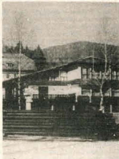
Cevi za prvo fazo vodovoda na Jezerskem že čakajo zložene pod Kazino