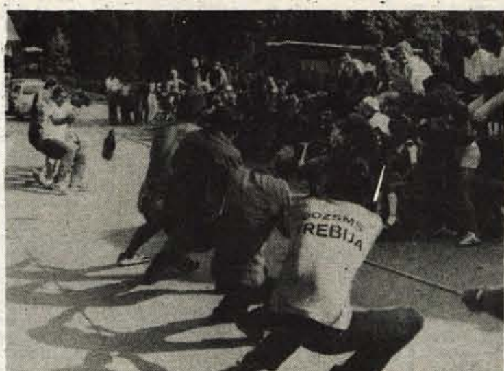
Trebijski mladinci so tudi dobri sportniki. Takole so se borili in zmagali na poletnih mladinskih igrah brez meja.

rajevni skupnosti je preplelo in preuredilo prostore v lovni šoli, prenovili so vitri pripravili so očiščevalno cijo ob Sori, oživili kulturno enje v kraju, začeli so poavljati avtobusno postajališorganizirali prvomajsko esovanje, izleta na Blegoš in glav, sodelovali so na obških mladinskih igrah, pripravili poletne Igre brez meja, organizirali nogometno tekmo d poročenimi in neporočeni in še marsikaj, kar je v njih dveh letih razgibalo enje v kraju. Veliko časa dela pa so porabili tudi za pravo tretje številke svoje glasila Pogled, v katerem skušali prikazati življenje v Trebiji. Pripravili so anke-