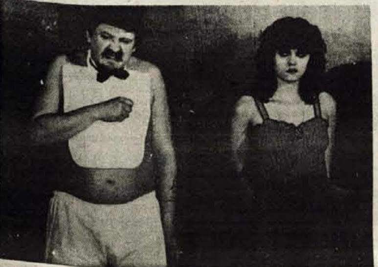
Prvih predstav — in to uspešna — je bila Ionescova Plešasta pevka, s to se predstavili na gostovanju na Poljskem.