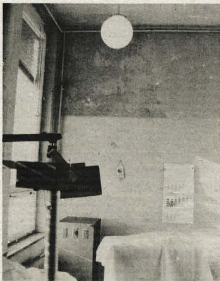
BLED — V eno od zobnih ambulant blejskega zdravstvenega doma že nekaj časa zamaka. Streha, ki je tako dotrajana in trhla, da jo je celo nevarno popravljati, pa čaka na denar za zamenjavo z novo.

Trenutno v Radovljici ne vidijo izhoda iz nakopičenih težav v njihovem zdravstvu. To, kar so lani lahko namenili za obnovo, je le drobec v široki paleti kričečih problemov, da o tem, kako je danes treba vendarle tudi v korak s časom, sploh ne govorimo. Posodobitve pa so verjetno še najbolj potrebni v bohinjskem kotu, kjer so bili vrsto let gle-