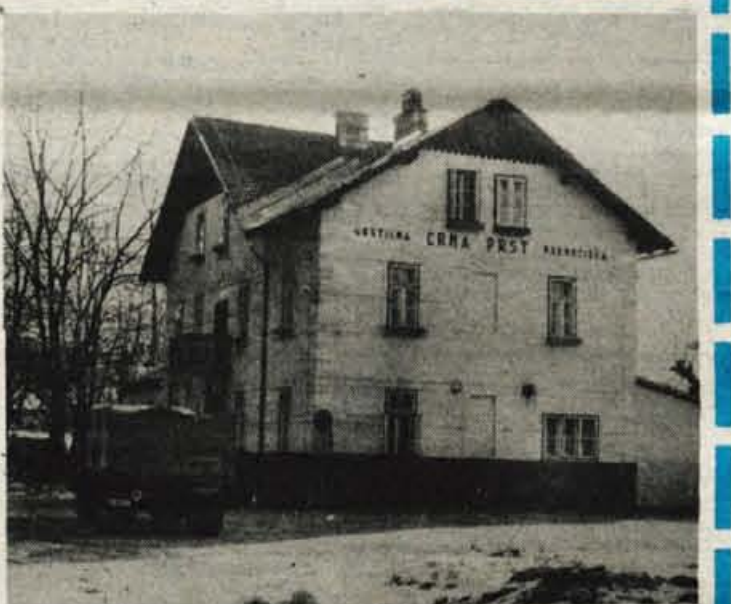
Gostišče Črna prst v Bohinjski Bistrici je bilo zadnjič obnovljeno 1950. leta.