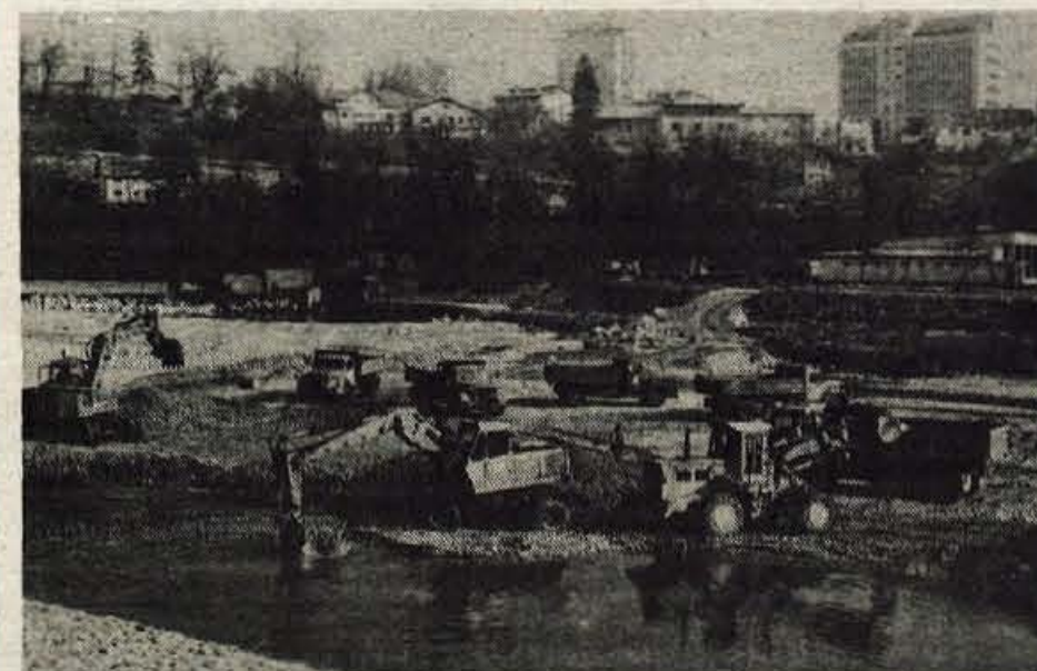
Lovilna jama za gramoz — Da Sava ne bi prehitro zaprodila dna bodočega jezera za elektrarno v Mavčičah, so pod jezom pri Tekstilindusu v Kranju uredili lovilno jamo za gramoz. — A. Ž.