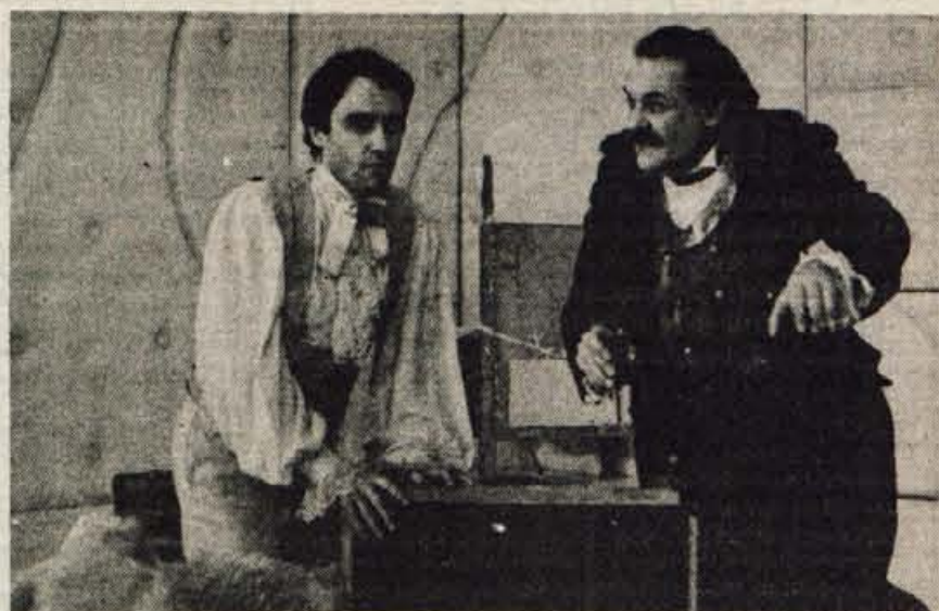
Celjsko gledališče je lani uprizorilo dve slovenski drami, ena je bila Cankar-jeva Za narodov blagor