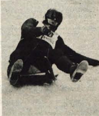
Na zelezeneli progi je bilo treba pokazati obilo spretnosti in znanja.