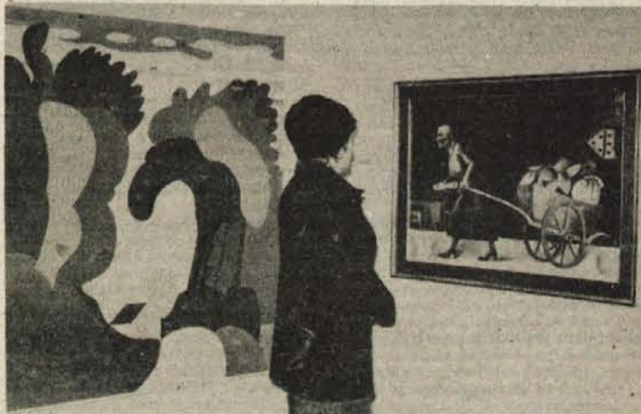
Kranj — Blizu trideset gorenjskih likovnih ustvarjalcev te dni v Gorenjskem muzeju razstavlja svoje delo na temo Mesto in človek.