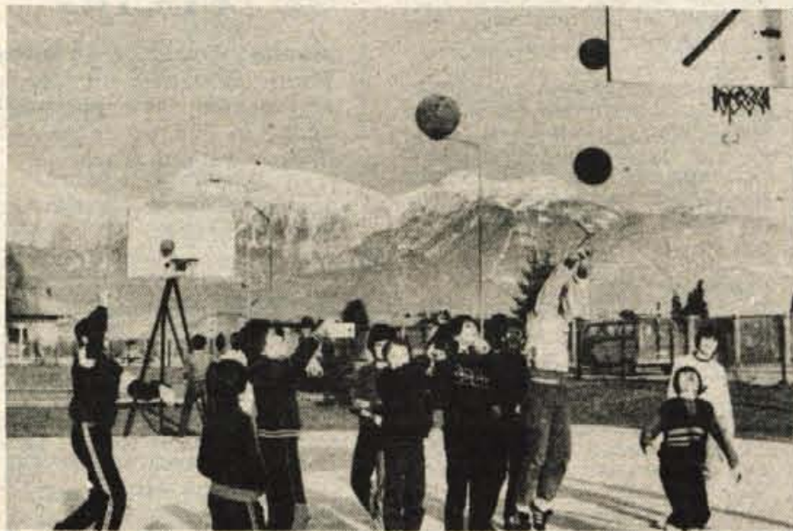
Smučanje postaja drago, zato si ga bodo te počitnice lahko večkrat privoščili le otroci iz premožnejših družin. Tisti, ki imajo manj imovite starše, pa se v mili zimi znajo zabavati tudi drugače. In vendar počitnice niso nič manj zanimive.

stran 8: Dogovorimo se: Tržič — gradivo za sejo ob- činske skupščine