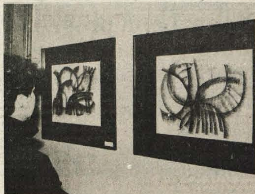
Radovljica — Te dni so v skupščinskih prostorih že zamenjali razstavo: namesto slik obeh Faganelov in Kovačiča bodo kmalu obesili slike, ki so jih ustvarili likovniki amaterji iz leške Verige.