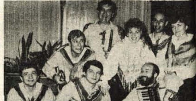
Zaigra pa tale RŽ in zapoje, da malokateri ansambel ta

Pa je za nami večer v hotelu Creina, ki smo ga tako zelo pričakovali. Kako hitro mine vse lepo; ostanejo pa spomini in človek je kot preroben. Količko je vredno, da se usedeš k lepo pogrnjeni mizi, si prijazno postrežen, da drugi kuhajo, drugi skrbijo zate, ti le sedi in uživaš.