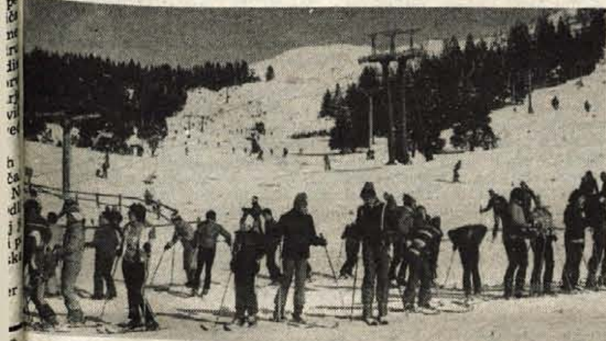
Krvavška smučišča lahko dnevno sprejmejo pet tisoč smučarjev, pa je smuka še vedno varna. Le vrste so nekoliko daljše.