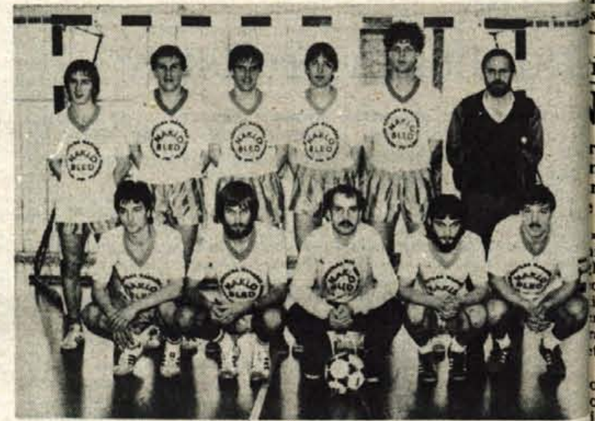
Na sedmem zimskem turnirju v malem nogometu je moštvo Nakla v skupini mladih osvojilo drugo mesto.