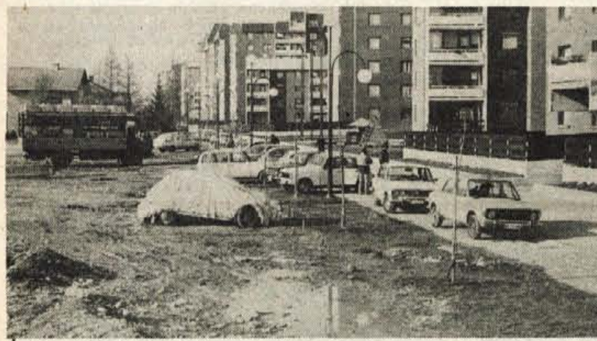
Zakaj tako in do kdaj še — Prvo leto po vselitvi so stanovalci blokov v Ulici Tuga Vidmarja še z razumevanjem gledali na neurejeno okolico pri vseh št. 2 in 4. Blato, kupi odpadnega materiala in prava jezera vode pa jim zdaj že krepko presedajo, posebno še, ker se je stanovanjska gradnja na Planini preselila na drugi konec. Sprašujejo se, zakaj tako in do kdaj naj bi še prenašali takšno neurejenost. — A. Z.

»Na šiht sem hodila tri ure peš s Kamnjeka v Tržič. Potlej sem dobila