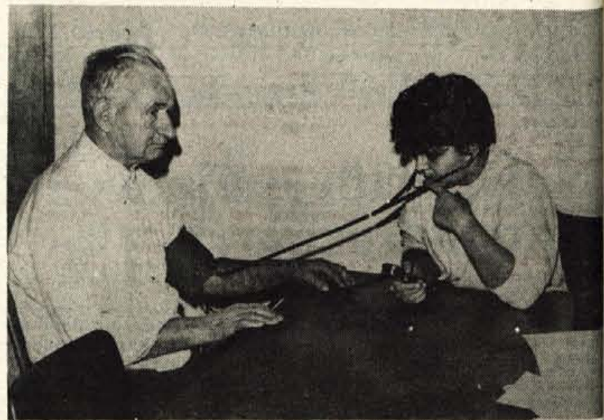
Ze pet let merijo krajanom krvni pritisk — V Gorenjskem glasu smo že hvalili Kranjčane, ki so se lotili merjenja krvnega pritiska, potem smo pa v prostorih krajevne skupnosti v Lescah po naključju odkrili, da delavci krajevne organizacije Rdečega križa v Lescah merijo krvni pritisk že pet let: poleti enkrat na teden, pozimi pa enkrat na štirinajst dni, vselej ob torkih. Pozimi od 16. do 17., poleti pa od 17. do 18. ure. Pritisk prihajajo merit vsi krajan, ki se morda tedaj malo slabše počutijo, predvsem pa redno prihajajo vsi z visokim pritiskom. Vsakic se oglasi vsaj 20 krajanov. — D. Dolenc