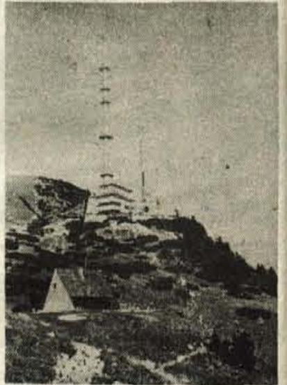
Nov televizijski stolp tik pod vrhom Krvavca je visok 107,5 metra.

Zapisali smo že, da so bili ljubljanski študentje prvi, ki so začeli s turnim smučanjem na Krvavcu že leta 1911. Tu so smučali tudi vsa leta pred vojno, vendar pa je bil tisti čas Krvavec najbolj obiskan poleti, ko je bila tam živa planšarija. Krvavec je pravi razvoj doživel šele s prvo dostopno žičnico, ki so jo odprli za kranjski občinski praznik, 2. avgusta leta 1958. To je bilo v krvavškem pogorju prelomno leto. Vendar razmah prva leta ni bil hiter. Šele leta 1966 je bila speljana prva vlečnica iz Tihe doline na Njivice, leta 1970 prva dvosedezna Tiha dolina. Leta 1973 je Krvavec dobil krožno kabinsko žičnico. Vse dotlej smo se na Krvavec vozili na odprtih sedežih in se zavijali v debele pelerine. Leta 1974 so zgradili dvosedeznico, ki vozi na vrh Krvavca. To leto je bila zgrajena tudi vlečnica Njivice 2 ter dve vlečnici za otroke, Luža in Podgradišče. Leta 1976 je bila zgrajena enosedeznica z Gospinca do doma na Krvavcu, 1978 dvosedeznica Kriška planina in vle-