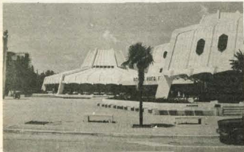
Bar je sodobno, hitrorastoče mesto, arhitekturno zanimiva je nova blagovnica.

Okusili smo tudi nekaj pregovorne črnogorske tradicije, ki ve, kdo je gospodar pri hiši, ki ždi v podzavesti kot spomin na herojske čase, ko je mož varoval dom, žena pa delala. Sodobni utrip življenja jo je v mestih že domala pozabil, in mladeniča, ki smo ga peljali s plaže do mesta, ni motila ženska za volanom, še več, dejal je, da že nekaj časa prepričuje ženo, naj naredi šoferski izpit. Toda večna tema moških pogovorov so ženske (pri nas hiše) in pozornemu prisluškovalcu ne more uiti, da je pogovorni ideal pridna, tiha ženica, ki čepi doma in posluša moža. Poslušaj, a naredi po svoje, pa rada pristavi marsikaterega, ko moža ni v bližini.