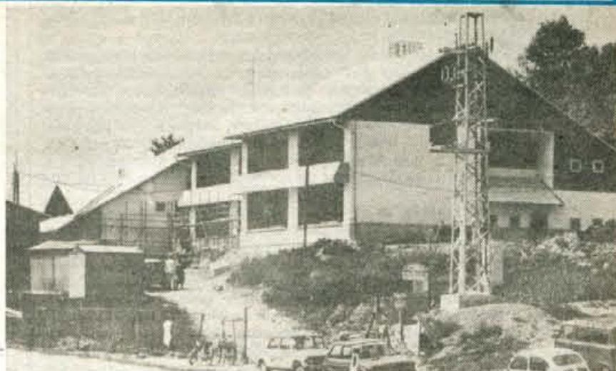
V Poljanah gradijo osnovno šolo — SGP Tehnik iz Skofje Loke s soizvajalci gradi v Poljanah novo osnovno šolo na osnovi referendumskega programa. Gradnja poteka po programu, želja krajanov pa je, da bi bila šola do njihovega krajevnega praznika odprta. (jk)

Kranj, 25. avgusta — V nedeljo zvečer je bil končan 26. gorenjski sejem. V kranjskem Poslovno-prireditvenem centru so zadovoljni, saj je bila prireditvev deležna laskavih ocen. Obiskalo jo je okrog 110 tisoč ljudi, promet pa je dosegel blizu 20 milijard dinarjev. V to vsoto so všteta tudi vsa večja naročila. Prijetna popestritev je bil popoldanski in večerni zabavni program, gostinska ponudba pa je bila ob sprejemljivih cenah zadovoljiva. Obiskovalci so se pohvalno izrazili o zunanji ureditvi sejmišča. Mogoče bi kazalo v prihodnje še bolj popestriti sejemske popoldneve z modnimi revijami in drugimi prireditvami. Sejem so obiskali številni predstavniki našega družbenopolitičnega in gospodarskega življenja, med njimi predsednik republiške konference SZDL Jože Smole, predsednik slovenskih sindikatov Miha Ravnik in član sveta federacije Viktor Avbelj ter zastopniki Slovencev s Koroške. -jk