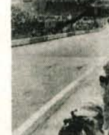
Fotoreporterji na delu

V tiskovnem središču je visel velik plakat, na katerega so se podpisovali akreditirani novinarji in fotoreporterji ter tako zaželeli poškodovanemu Jacquesu Laffitu čimprejšnjo vrnitev na tekmovalne steze.