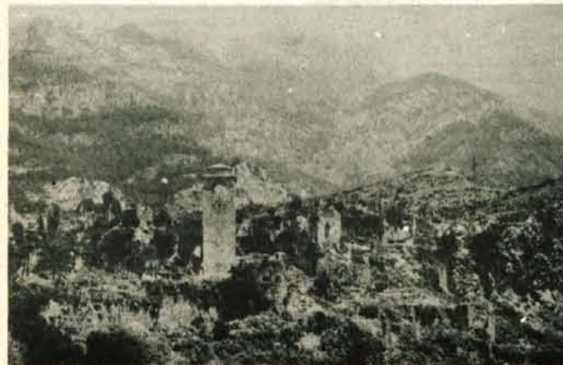
V Starem Baru je pod ruševinami starega mestnega jedra slikovita tržnica, ki privlači turiste.