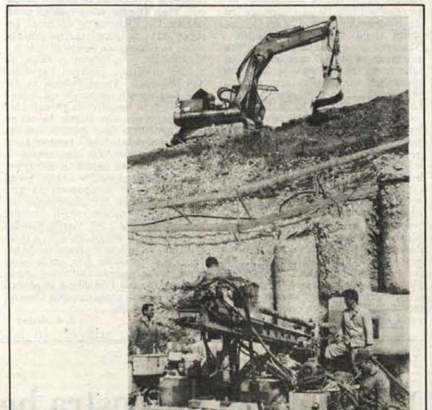
Zahtevna začetna dela v Karavankah — Delavci Geološkega zavoda iz Ljubljane sodelujejo pri najzahtevnejših začetnih delih za gradnjo predora skozi Karavanke. Skupaj z delavci Slovenijaceste bodo delali vse poletje, ker naj bi že avgusta začeli z vrtnimi stroji vrtati prvo cev predora.

Kranj, 14. maja — Kranjska podružnica Službe družbenega knjigovodstva je naredila zanimivo primerjavo o gibanjih osebnih dohodkov v gospodarstvu in družbenih dejavnostih v letih 1979 in lani. Leta 1979 so imele družbene dejavnosti povprečno 13 odstotkov višje osebne dohodke kot gospodarstvo. To leto je bilo v tem pogledu najugodnejše, potem pa se je položaj delavcev v družbenih dejavnostih poslabševal. Najslabše je bilo leta 1983, sedaj pa se razmere zboljšujejo, vendar so bili lani osebni dohodki v družbenih dejavnostih še vedno za 4 odstotke »prekratki«, da bi ujeli razmere iz leta 1979. Izobrazbena raven v družbenih dejavnostih je namreč višja in zato naj bi bili višji tudi povprečni osebni dohodki. Da rast osebnih dohodkov v družbenih dejavnostih še vedno zaostaja za rastjo v gospodarstvu, kažejo tudi izračuni, da so se osebni dohodki v gospodarstvu med letoma 1979 in 1985 dvignili za 775 odstotkov, upoštevajoč še letošnje prve tri mesece pa za 1137 odstotkov, osebni dohodki v družbenih dejavnostih pa brez letošnjih treh mesecev za 762 odstotkov, skupno pa za 1090 odstotkov. V večini gorenjskih občin je po osebnih dohodkih na najboljšem socialno varstvo in v Radovljici izobraževanje, na najslabšem pa zdravstvo. Le v trziški občini je na najboljšem zdravstvo, na najslabšem pa vzgoja in izobraževanje. —jk