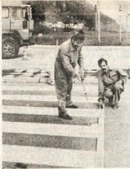
Majsko pleskanje cest — Hkrati s krpanjem in obnovo cest na Gorenjskem, ki jih je minula zima zelo načela, že nekaj časa traja tudi obnavljanje in urejanje talne cestne signalizacije. Še pred začetkom turistične sezone naj bi jo uredili predvsem na najbolj prometnih in nevarnih odsekih. — A. Ž.