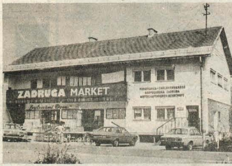
Poslopje Kmečke gospodarske zadruga v Šentjanžu