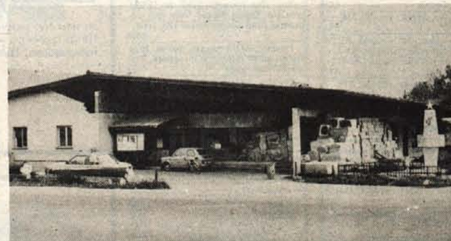
Godešič — Krajevna skupnost Godešič in ABC Loka razširjata trgovsko stavbo na Godešiču. Krajevna skupnost bo uredila družbene prostore, ABC Loka pa bo pridobila večjo in sodobnejšo trgovino, ob kateri bo tudi bife. Trgovina bo odprta jeseni, predračunska vrednost pa znaša okrog 55 milijonov dinarjev. (H. J.)