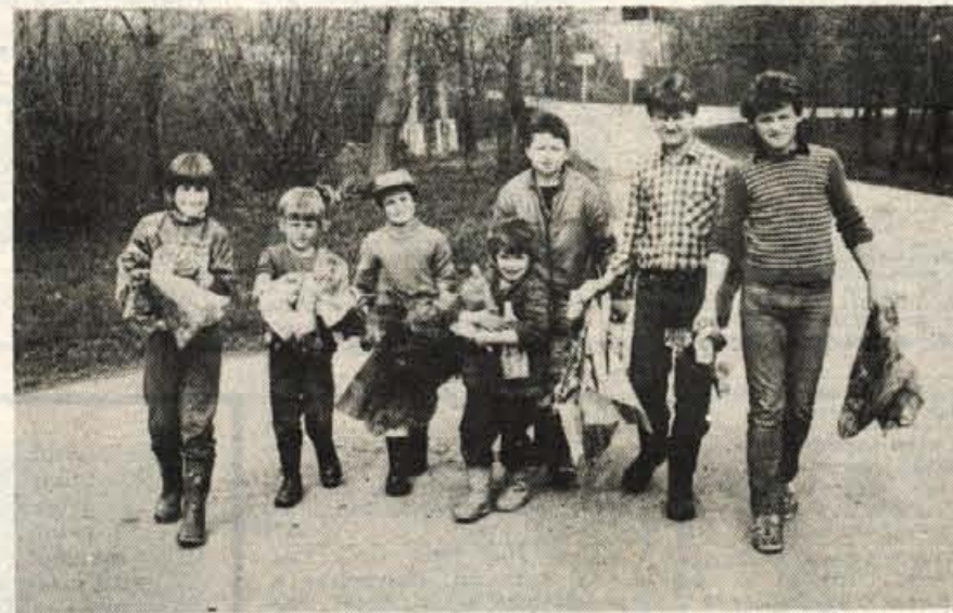
Spomladanske očiščevalne akcije se kar vrstijo. Na sliki: mladi Belani so iz Belice, ki že zdavnaj ne zasluži več tega imena, navlekli na kuppe nesnage.