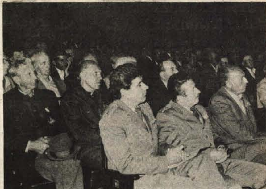
Dan zmage so borci I. proletarske divizije iz Srbije po 41 letih spet praznovali med Gorenjci