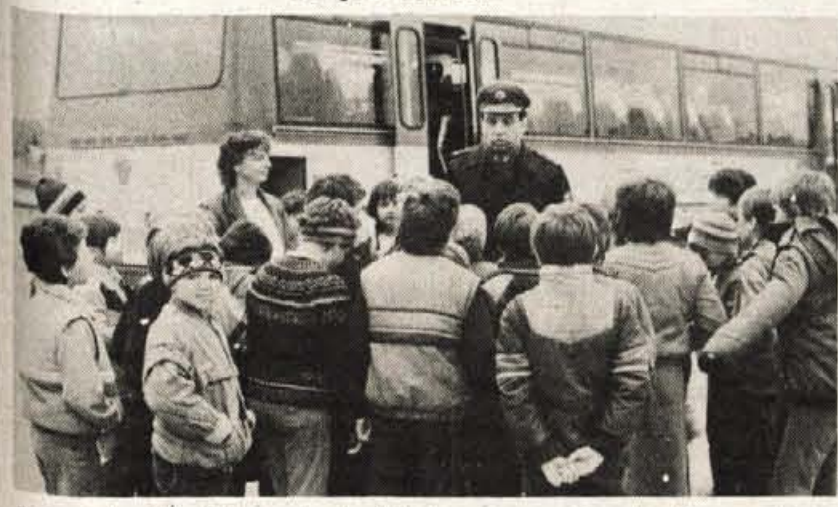
Prometni miličnik je zvedavim šolarjem odgovoril na številna vprašanja o prometu.

in v krožkih. Od šole so jih odpeljali proti vzhodni obvoznici na Delavski most, mimo Labor na zahodno obvoznico, po Koroški cesti skozi mesto, nato pa ven iz mesta na »hitro cesto« do avtoceste, z nje pa znova v Kranj.