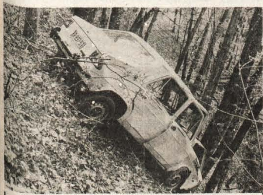
Na poti z Jošta se je 30. aprila vozniku stoenke primerila nezgoda. Zapeljal je s ceste po bregu in se ustavljal med drevesi. O posledicah miličniška poročila ne govorijo, so pa vsaj na vozilu vidne. Vozniku najbrž ni bilo hudega, razen da se je ob zviti pločevini hipoma streznil.