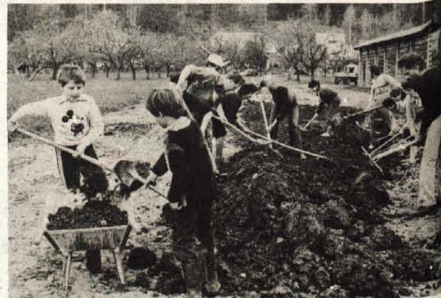
Podbrezje, aprila — Prebivalci zaselka Srednja vas v krajevni skupnosti Podbrezje so pred prvomajskimi prazniki s prostovoljnimi delom izravnavali zemljišče, kjer so lani vgradili cevovod za odvodnjavanje meteornih voda. Mladi in starejši so zavihali rokave in po ugrezninah razgrnili navoženo zemljo, da bodo na njej spet lahko zasejali travo. Sedaj je zgrajen le glavni vod, zato si bodo v gradbenem odboru prizadevali, kot so povedali njegovi člani, za pridobitev potrebnega denarja in za gradnjo razvodov s priključki nanj. (S)

Predstavnik Vodnogospodarskega podjetja iz Kranja je povedal, da so obvestilo o nesreči dobili pozno, šele po 12. uri, tudi ocena, da je izteklo le 300 do 500 litrov mazuta, ni bila pravilna, saj zdaj ugotavljajo, da ga je izteklo desetkrat več. Če bi bilo obveščanje pravočasno in pravilno, bi bilo onesnaženje Save znatno manjše, saj bi mazut lahko ustavili in ga več pobrali v energetskem kanalu vodne elektrarne v Majdičevem logu. V nedeljo popoldne so tam pobrali pet sodov strjenega mazuta, v Prašah pa so čez reko položili barazo, s pomočjo katere iz reke pobirajo mazut. Včeraj so čiščenje nadaljevali, na pomoč pa so poklicali posebno ekipo Hidro podjetja iz Kopa, saj je Savina voda toplejša in na gladini nastaja emulzijski film. M. Volčjak