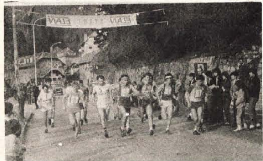
Start spominskega teka Boruta Berganta