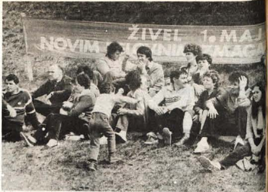
Prvi maj slavi že stoletnico — 1. maja 1886. leta je začelo v Chicagu stavkati 40 tisoč delavcev za izboljšanje delovnih razmer in za skrajšanje delovnega časa. Takrat je trajal še po 14 ur na dan. Tri leta kasneje je bil na ustanovnem kongresu II. Internacionale v Parizu v spomin na čikaške žrtve prvi maj razglašen za mednarodni delavski praznik. 1890. leta so ga delavci prvič praznovali. Še pred zadnjo vojno so ga naši delavci praznovali skrivaj, vsa povojna leta pa je to resnični praznik vseh naših ljudi. Na sliki: Kranjčani so se tudi letos zbrali na Joštu.