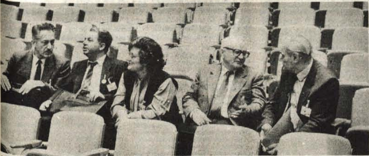
Pred začetkom kongresa