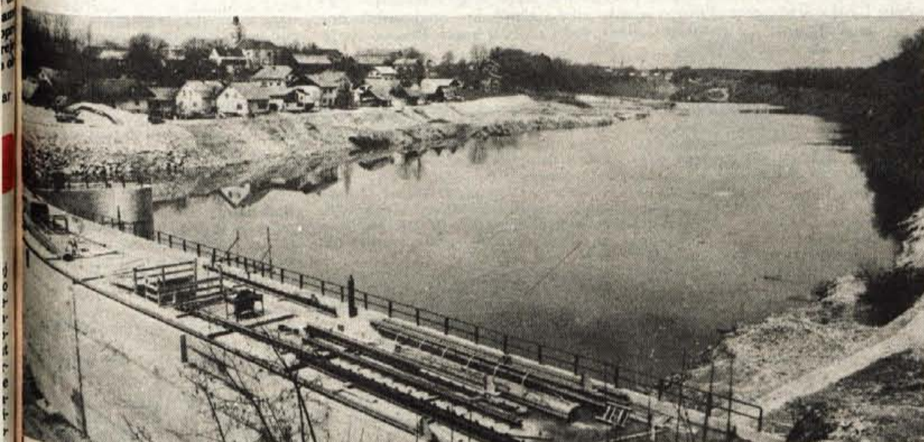
Za jezom že nastaja jezero — Minuli četrtek so v vodni elektrarni Mavčiče spustili zapornice in za jezom je začelo nastajati akumulacijsko jezero. Ni več torej daleč dan, ko bo nova elektrarna dala prve kilovatne ure električne energije. Menijo, da bodo čez mesec dni pognali prvega izmed obeh agregatov, drugega pa tri mesece kasneje.

GLASILO SOCIALISTIČNE ZVEZE DELOVNEGA LJUDSTVA ZA GORENJSKO