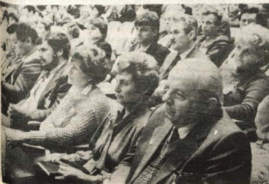
Del gorenjskih delegatov

Le redki so bili doslej v zgodovini Zveze komunistov Slovenije kongresi, od katerih bi ljudje toliko pričakovali, kot prav od zdajšnjega. Vsa širina in ostrina problemov sta prišli na dan med tridnevним srečanjem v Cankarjevem domu. Kdo drugi je poklican, da bo potegnil voz iz blatnih kolesnic, kot prav zveza komunistov skupaj z ljudmi, delavci, mladino, borci, kmeti, znanstveniki, snovalci novega. Zato smo še posebej poudarili, da je izhod iz krize svoje znanje, opleniteno z dosežki iz tujine, da ni druge možnosti kot sodobna proizvodnja, vpeta v mednarodne tokove, da je bistveni pogoj, narediti povsod takšno vzdušje, da bo lahko vsak ustvarjalno in dobro delal, da bo za to primerno nagrajevan in ne tepen. Zveza komunistov mora ustvarjati takšne razmere. Za to je zgodovinsko poklicana in takšna je njena odgovornost tudi v prihodnje.