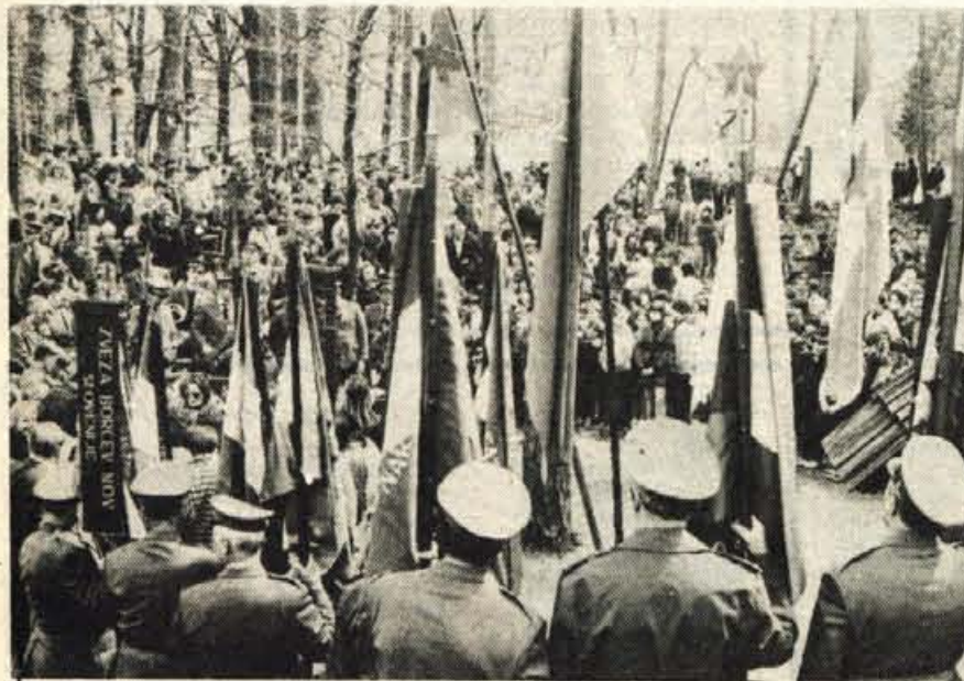
Okroglo v znamenju mladih — Lepa nedelja je na proslavo na Okroglo privabila veliko množico nekdanjih aktivistov in borcev, Kranjčanov, Nakelčanov in drugih Gorenjcev. Predvsem pa veliko mladih. Priljubljene proslave so to, ker niso dolgočasne, ker jih pripravljajo mladi za mlade, svoj udarni ton pa daje vsakič kranjska godba na pihala. Tokrat so spet ubrano zapeti in zaigrali otroci iz osnovne šole Franceta Prešerna iz Kranja.