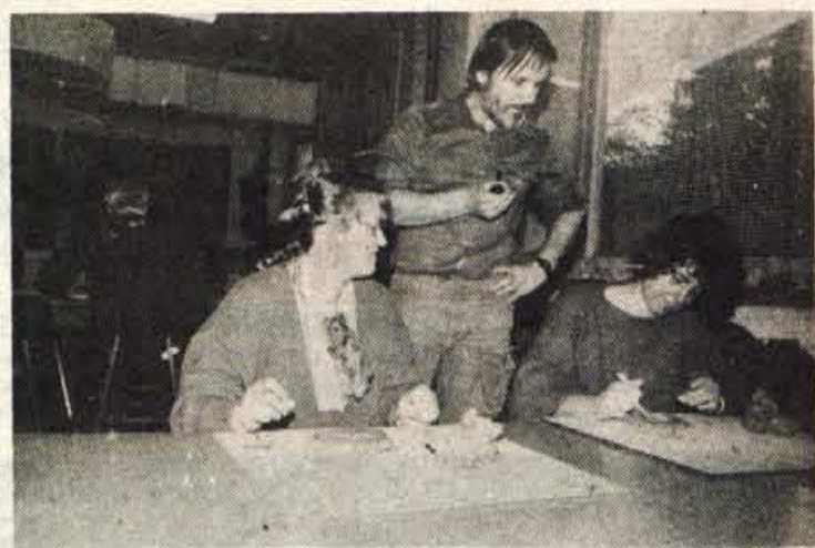
Kranj — Na desetih srečanjih bodo tečajniki spoznali osnovne zakonitosti oblikovanja z glino.