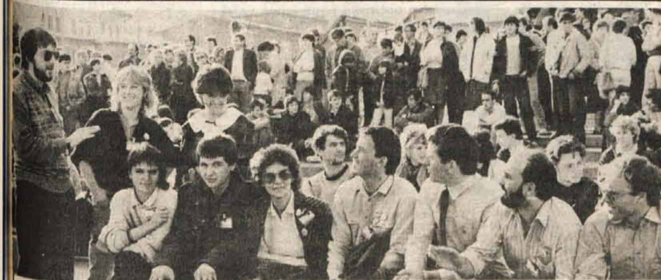
Krško, 6. aprila — V petek, soboto in nedeljo je bil v Krškem dvanajsti kongres slovenske mladine, na katerem se je zbralo prek štiristo delegatov. Prav tako živahno kot v kongresnih dvoranah je bilo te dni tudi v mestu, kjer so ob kongresu pripravili številne prireditve. Na sliki: skupina mladih z Gorenjske, ki je na kongres poslala 25 delegatov. — Foto: F. Perdan

GLASILO SOCIALISTIČNE ZVEZE DELOVNEGA LJUDSTVA ZA GORENJSKO