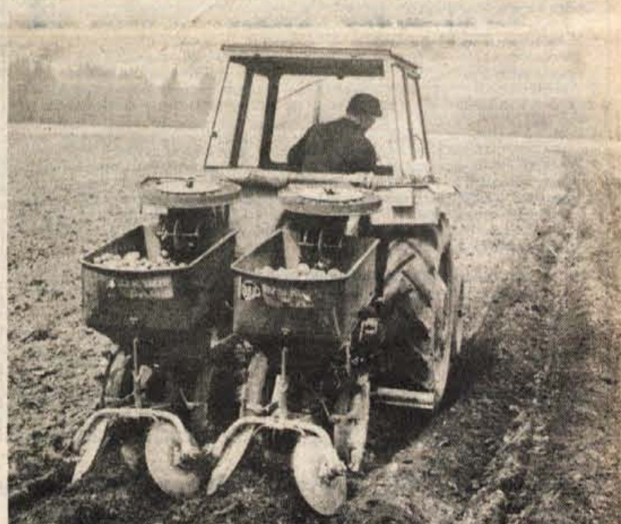
Oživila polja — Sneg je odlezel, zemlja se je odpočila in prišel je čas intenzivnih kmečkih del. Kmetje pravijo, da je dolgo trajajoča snežna odeja poljščinam dobro dela. Med prvimi spomladanskimi opravili na polju bo sajenje krompirja.