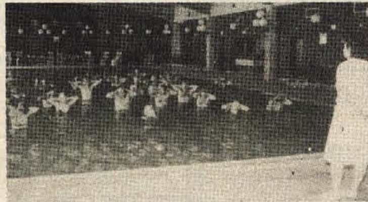
Tudi telovadba v vodi je pod strokovnim vodstvom

V zdraviliški šoli hujšanja najprej določijo, kakšne vrste hujšanje je potrebno uporabiti