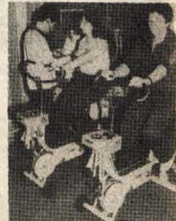
Rekreacijski program v trim kabinetu je vedno pod nadzorstvom zdravstvenega osebja