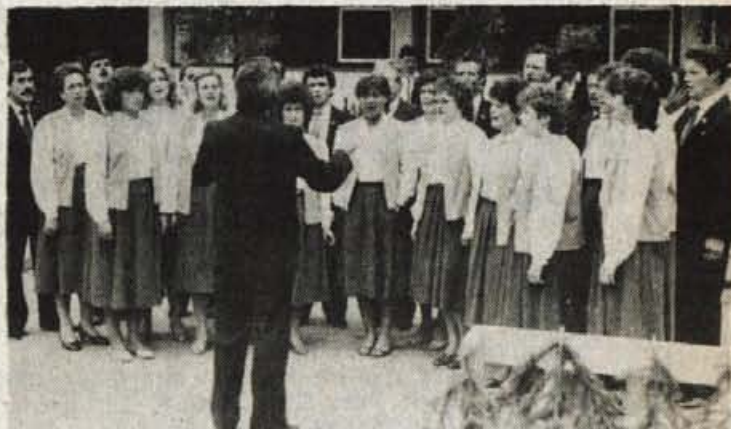
MEŠANI PEVSKI ZBOR ZARJA IZ ŽELEZNE KAPLE