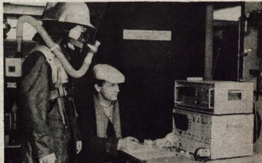
Merjenje obremenitev pri poklicnih gasilcih — Delavci dispanzerja za medicino dela pri kranjskem zdravstvenem domu že tretje leto opravljajo raziskovalno nalogo po naročilu poklicnih gasilskih enot in Zveze skupnosti za varstvo pred požari v SR Sloveniji. Ugotovljajo namreč vpliv delovnih razmer na zdravje in delovne zmoglosti prek 400 poklicnih gasilcev. Raziskava z več kot 600 podatki za vsako osebo bo končana predvidoma do konca junija letos, uporabiti pa jo bo moč pri poklicnem izobraževanju, varnostnem usposabljanju, kondicijskem urjenju in drugih nalogah poklicnih gasilcev. Med drugim naj bi z njo potrdili tudi domnevo, da delovna zmoglost poklicnih gasilcev z naraščanjem starosti zelo upada. Na sliki: gasilec poklicne enote v Kranju v popolni opremi pred nedavno namišljeno vajo gašenja, med katero so preverjali rezultate testiranja delovnih zmoglosti gasilcev. (S) — Foto: F. Perdan