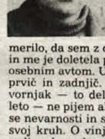
stejšje seganje roke pravice proti vinjenim udeležencem v cestnem prometu.

Vsa ta prizadevanja žal še niso bistveno okrnila naših pivskih navad. Ker je samozaščitno ravnanje voznikov še vedno redkost, lahko upravičeno pričakujemo še pogo-