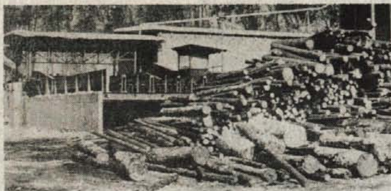
Kvalitetna smreka zagotavlja dobro sulfitno celulozo. V Rebrco prihaja iz vse Avstrije. Ob kupu hlodovine nov avtomatski lupilni stroj

Tovarna celuloze Obir je mešano avstrijsko-jugoslovansko podjetje. V tako osnovanem podjetju se je po ustavitvi proizvodnje julija leta 1978 ponovno začela proizvodnja 20. julija leta 1979. Avstrijski družabnik Rebrce je Kaerntner Betriebsansiedlungs und Beteiligungsgesellschaft m. b. H.