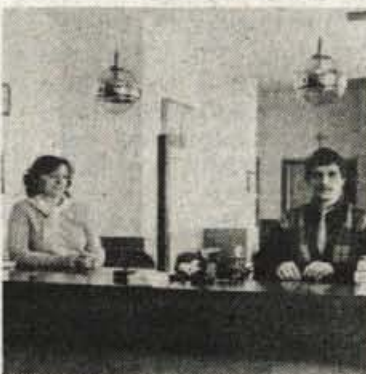
SEDANJI PROSTOR ZA STRANKÉ V SLOVENSKI POSOJILNICI V ŽELEZNI KAPLI. PRETESEN JE ŽE, ZATO SE BODO LETOS LOTILI RAZŠIRITVE.

Kapelska posojilnica je prerasla v pomemben dejavnik gospodarstva. Njej zaupajo svoje prihranke tako slovenskogovoreči kot nemškogovoreči prebivalci Kaple in okolice, vključuje pa se tudi v gospodarsko življenje občine, saj prek nje poslujejo, na primer, Tovarna celuloze Obir iz Rebrce, hotel Obir iz Železne Kaple, podjetja IPH iz Žitare vasi in drugi. O rasti slovenske denarne ustanove dovolj zgovorno pričajo podatki: leta 1980 je znašal promet 910 milijonov šilingov, leta