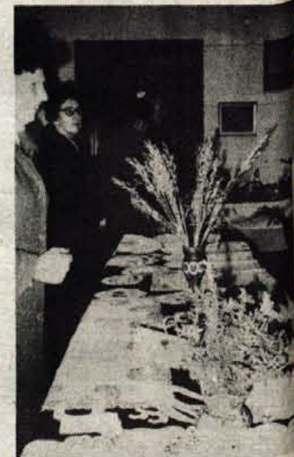
Čipke so na razstavi požele največ obdivovanja.

Razstavo smo pripravljale članice vseh aktivov, ki jih je v naši Kmetij-