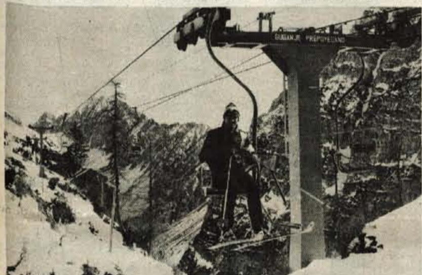
Zaradi zastarelih naprav je vožnja na Zelenico hladna in dolgotrajna.

V samski dom na Planini je ondan prišel neznanec. Vdrl je v intimni prostorček v klubu, tam odmontiral straniščno školjko, pisar, umivalnik in pipo in z vsem tem mirno odšel. Ga je morda kdo videl?