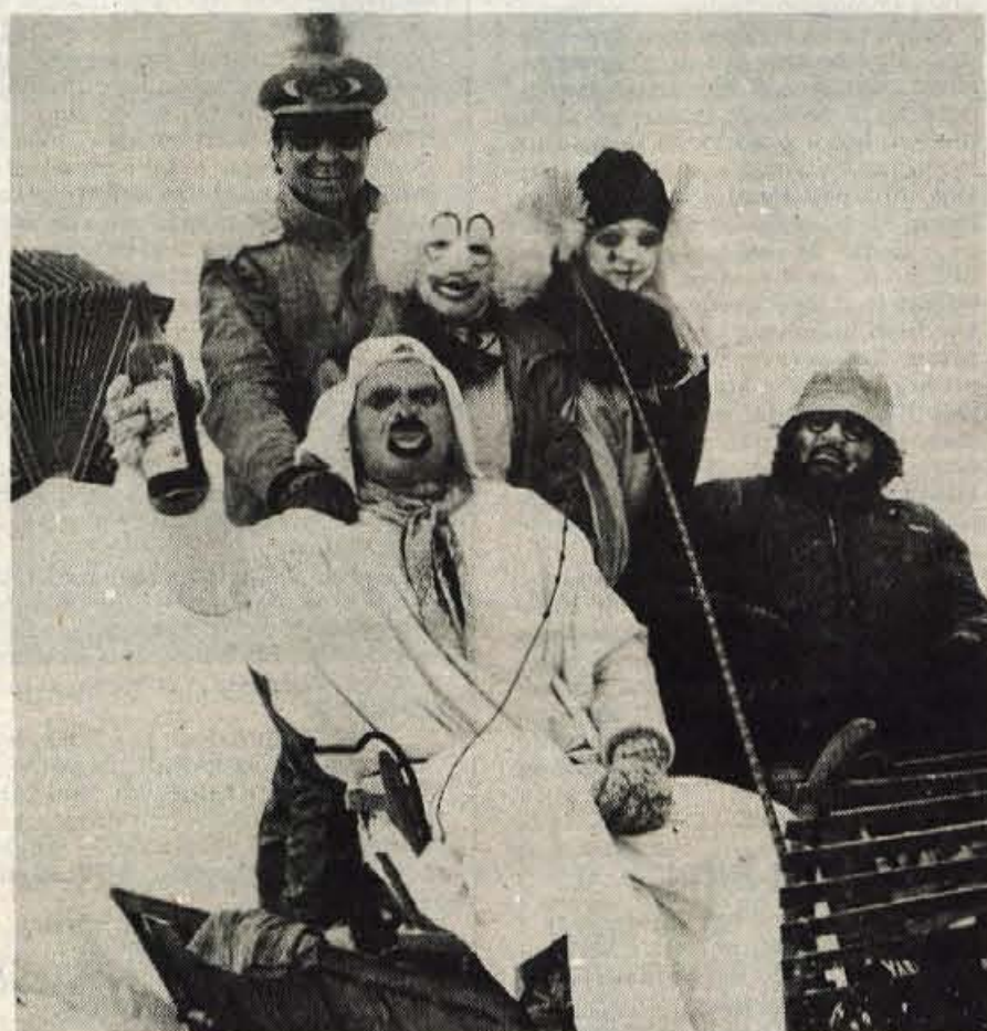
Škoda, da se lahko samo še danes, na pustni torek, skrijemo za veselo, hudomušno in radoživno masko! S pokopom v sredo bomo pustne maske odložili, po tem okrutnem svetu bomo pač morali hoditi z vsakdanjimi.

stran 12: Protest proti onesnaže- valcem zraka