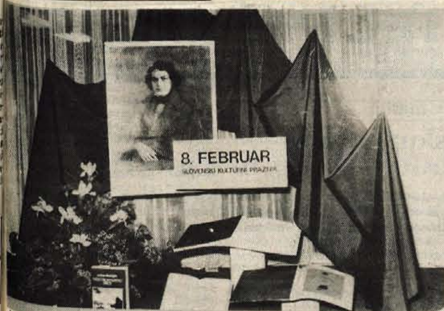
Eno redkih lepo urejenih in prazniku slovenske kulture posvečenih iz- ložb so imeli v Kokrini prodajalni v Prešernovi ulici v Kranju. Toda mar je zunanji izgled vse? Z vrsto prireditev smo se spomnili letošnjega 8. februarja, podelili nagrade najzaslužnejšim delavcem s področja kulturne ustvarjalnosti. Še važnejše pa bo, če ne bomo kulturni le na kulturni praznik, temveč bo kultura del naše vsakdanjosti.