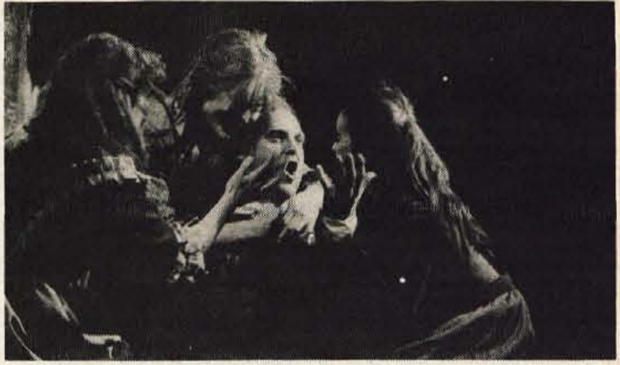
Slovensko mladinsko gledališče se predstavlja z dvema predstavama. Na sliki prizor iz Svetinove Lepotice in zveri