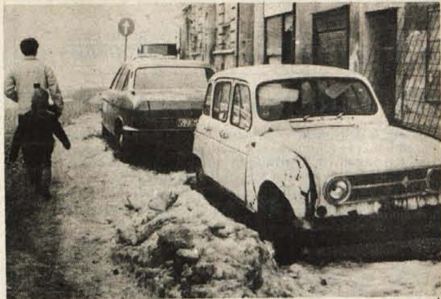
Kranj — Katrca na sliki že dolgo stoji pred Dekorjevo prodajalno, malo naprej pa zaseda prostor za pešce vozilo z registrsko številko KR 105-007. Zaradi lastnikov pokvarjenih vozil, ki jih tako brezbržno postavijo na nepravni prostor, ni moč temeljito očistiti snega s pločnika. Še huje in nevarneje pa je, da morajo pešci zato hoditi po robu cestišča! (S)

Zelenici, ki jo smučarji morebiti še preslabo poznajo, se torej obeta postopni razvoj. Upajmo, da bodo sodobnejše naprave in več smučarskih površin kasneje sem gor privabile tudi smučarje, ki zdaj mimo tega privlačnega gorenjskega smučarskega središča hitijo v Avstrijo. D. Z. Zlebir