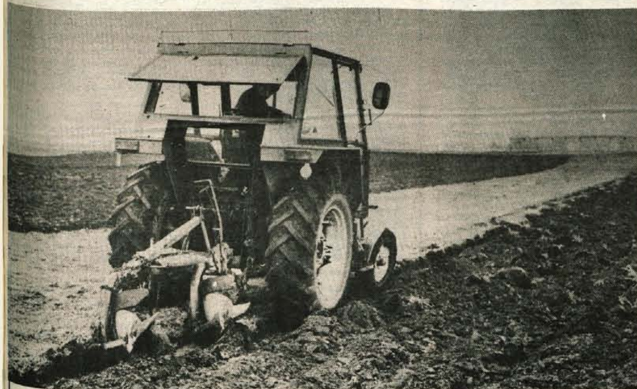
Kmetje spet orjejo — Letošnja jesen je bila sušna — skoraj dva meseca ni deževalo — zato tudi vsi kmetje niso uspeli pravočasno posejati pšenice in pripraviti zemlje za zimski počitek. Zgodnje snežne padavine so ponovno presenetile zapoznele orače, ki zdaj, v decembrskih dneh, ob snežni odjugi skušajo nadoknaditi zamujeno.

GLASILO SOCIALISTIČNE ZVEZE DELOVNEGA LJUDSTVA ZA GORENJSKO