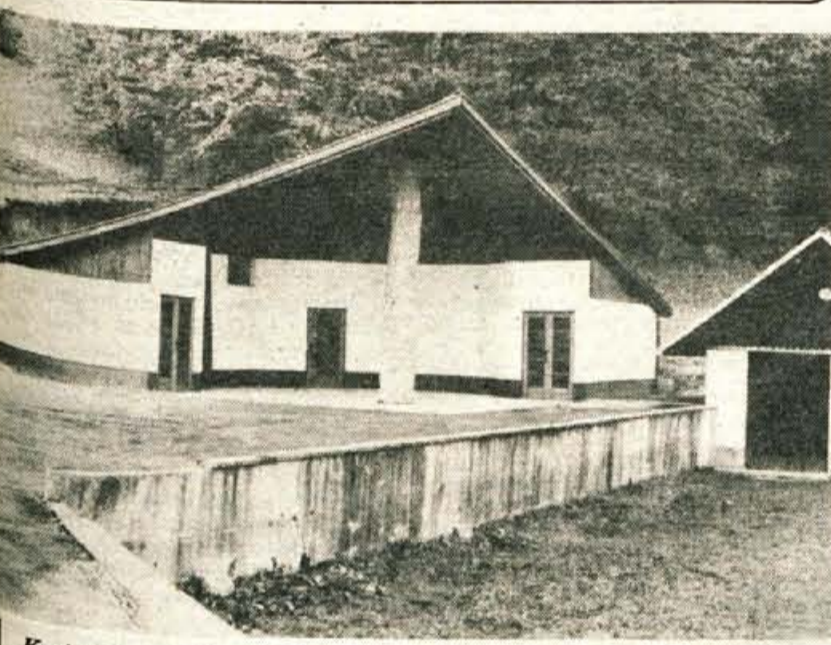
Krajevni praznik v Podnartu — Ob krajevnem prazniku se vselej spomnijo, kar so naredili v tekočem letu. Letos so asfaltirali parkirišče pri pokopališču na Ovisah in dogradili mrtiške vežice pri pokopališču, začeli so jih graditi avgusta lani. V krajevni skupnosti Podnart bodo osrednjo slovesnost ob krajevnem prazniku imeli v petek, 29. novembra, ko bo v domačem kulturnem domu proslava s kulturnim sporedom in podelitvijo priznanj.