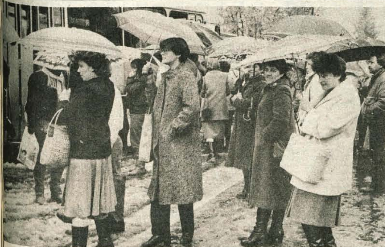
Gorenjsko je pobelil sneg, spet se stežka prebijamo po snežni brozgi na pločnikih. Ceste sicer plužijo, a je avtomobilom že potrebna zimska oprema. Ponekod je drevje vklestil žled. Več o letošnjem navembrskem presečenju na zadnji strani.

GLASILO SOCIALISTIČNE ZVEZE DELOVNEGA LJUDSTVA ZA GORENJSKO