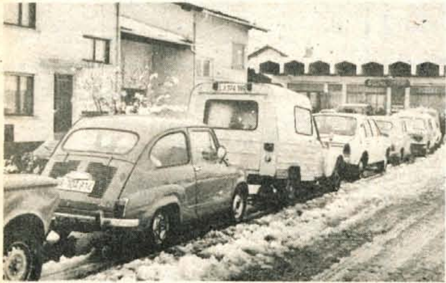
Sneg je presenetil tudi voznike, o čemer priča vrsta na kranjskem servisu za menjavo gum.

Gozdove po vsej Gorenjski je nad 600 metrov nadmorske višine vklenil žled. Gozdna gospodarstva zdaj pregledujejo gozdove in ocenjujejo, koliko škode je v gozdovih, ki so klonili temu ledenemu zlu.