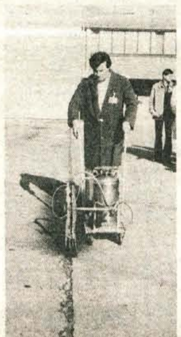
Pri popravilu je treba asfaltne razpoke najprej razširiti, nato pa zaliti. S stroji in škropilnico pa takšen postopek odpade.

škodb. Prve ocene strokovnjakov Zavoda za raziskavo materiala in strokovne službe Skupnosti za ceste Slovenije o Orličevih strojih in postopkih za popravilo asfaltnih poškodb