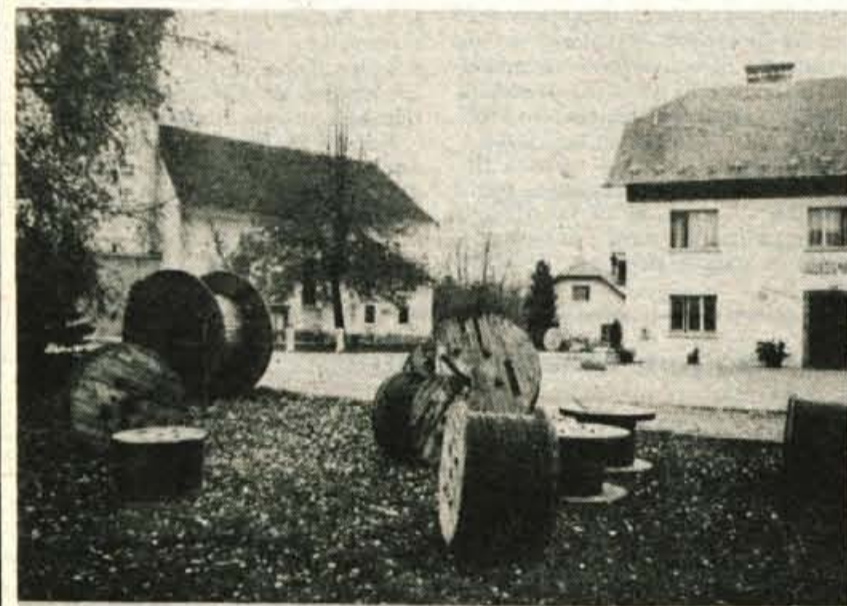
Gradnja telefonskega omrežja v krajevni skupnosti Zalog sodi med največje tovrstne akcije. Tudi obroči za kable kažejo, da jim bo uspela.