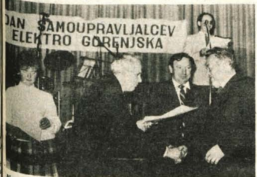
Na petkovem srečanju delavcev Elektro Gorenjske so delavcem podelili jubilejne nagrade, priznanja pa so namenili nekaj organizacijam in posameznikom.

gubo zato pomenijo udarec, ki se bo dolgoročno odrazil v slabih posledicah. Bajka o visokih plačah je spolitizirana fraza tistih, ki lahko komentirajo in govore o nas, je dejal, ter ob koncu omenil še problematiko preštevanih, tudi vsiljenih reorganizacij v elektrogospodarstvu, predvsem pa v distribuciji. Želimo si, je dejal, da bi imeli priložnost zastavljeno organizacijo preizkusiti v praksi in jo dograjevati, ne pa neprestano spreminjati. M. V.