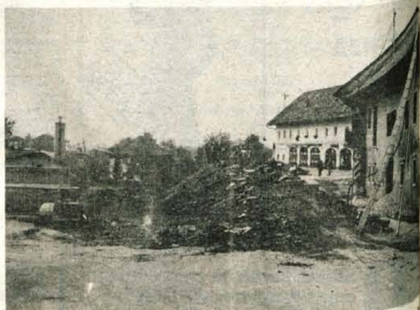
Za ureditev novega križišča pri odcepu proti železniški postaji bodo znižali cestišče, porušili pa dve stari stanovanjski hiši.