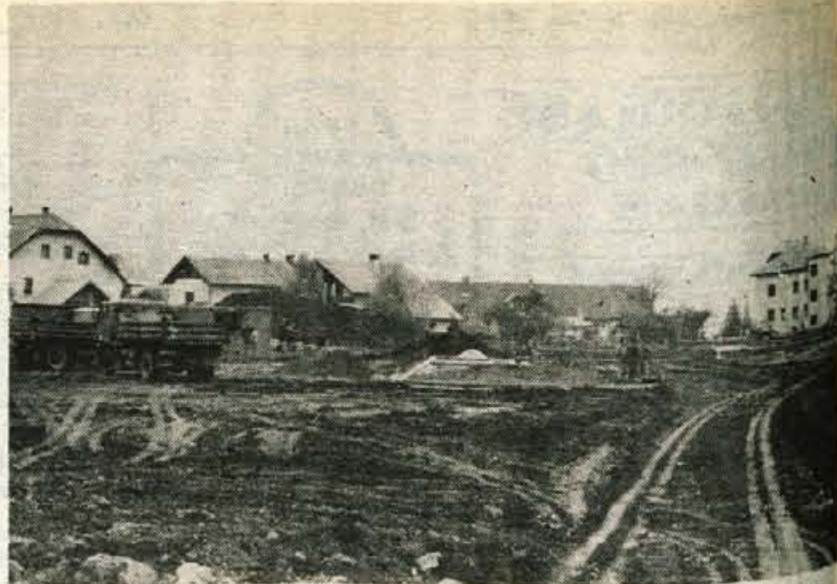
Med pokopališčem in otroškim vrtcem bodo zgradili tri stanovanjske bloke