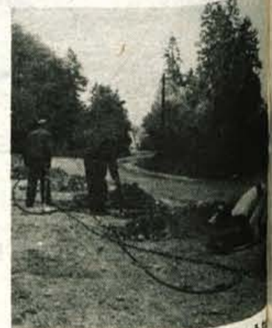
nosti pa so jim priskočili na pomoč tudi Iskra Kibernetika, Tekstilindustrija Merkur. Do spomladi prihodnje leto nameravajo zgraditi prvi del igrišča. A. Z.

Krajanje bodo za to akcijo prispevali 1400 prostovoljnih delovnih ur, nekateri pa tudi denar. Razen združenih sredstev občine in sredstev krajevnih skup-