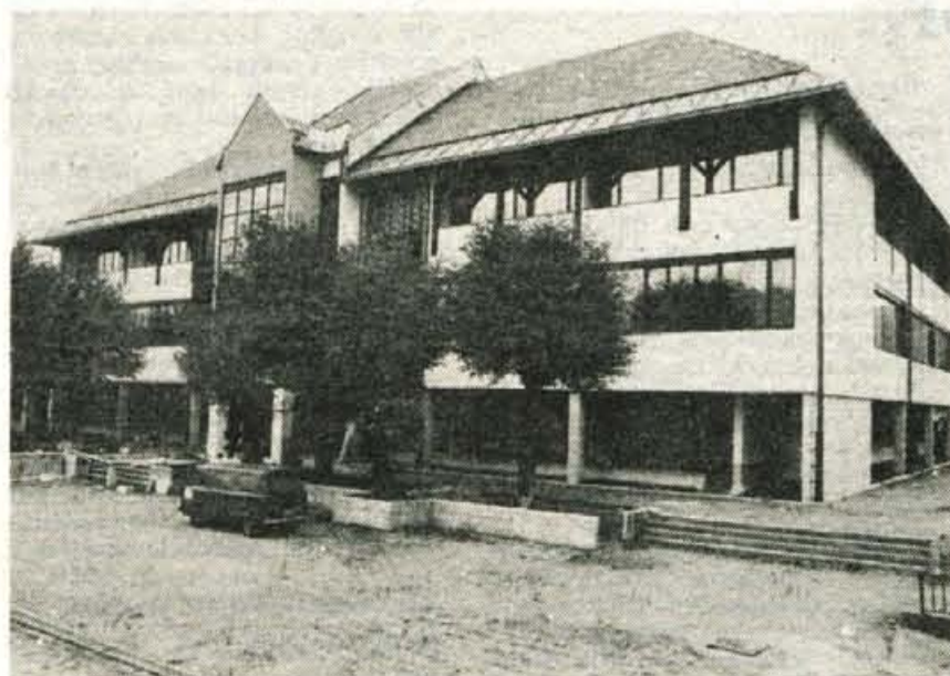
Izobraževalni center Intertrade v Radovljici — Ob hotelu Grajski dvor v Radovljici je Intertrade iz Ljubljane zgradil izobraževalni center IBM, ki ga bodo slovesno odprli v petek, 22. novembra. Objekt so zgradili dokaj hitro, tudi njegova zunanja podoba se prijetno vključuje v podobo starega dela Radovljice. Gradnja je veljala 60 milijonov dinarjev, dosti več bo vredna sodobna računalniška oprema. Center bo namenjen izobraževanju kadrov za delo na računalnikih IBM, v Radovljici bo jugoslovansko središče tovrstnega šolanja, izobraževalni program pa nameravajo še razširiti.