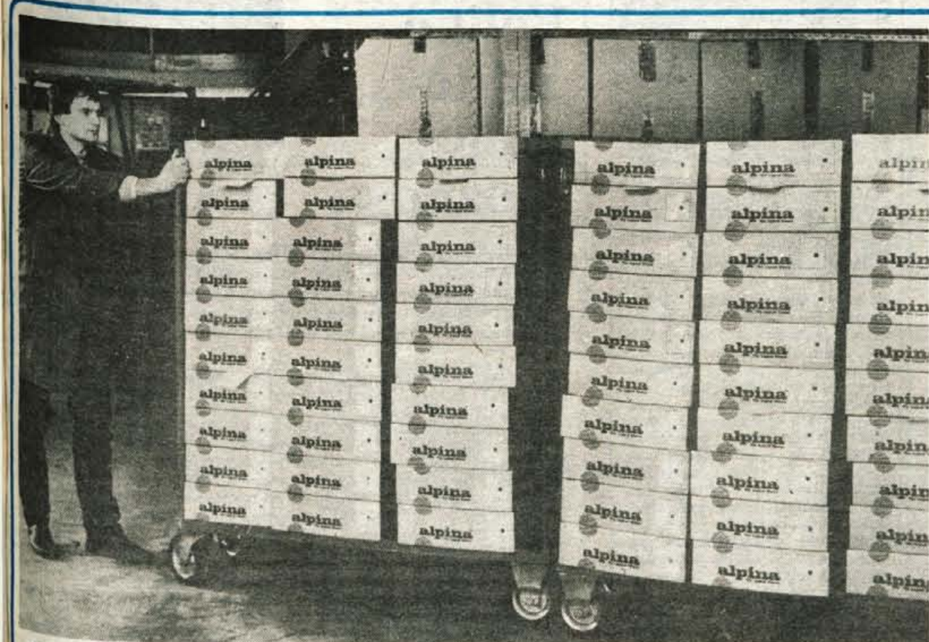
Alpinin izvirni smučarski čevlji na tujem ni cenejši kot doma.