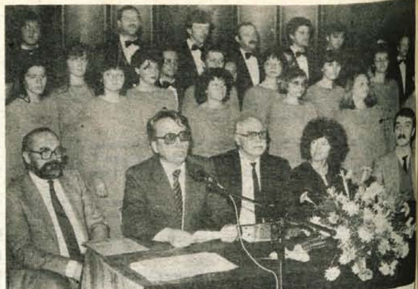
30-letnica BGP Kranj — Kolektiv Bolnišnice za porodništvo in ginekologijo Kranj je v petek zvečer v Domu JLA s svečano sejo delavskega sveta proslavil obletnico svoje ustanovitve. Ob tej priložnosti so dolgoletnim delavcem podelili priznanja. Med gosti, ki so jih povabili na proslavo jubileja, je bil tudi predsednik skupščine SR Slovenije Vinko Hafner. V kulturnem programu je sodeloval Akademski pevski zbor France Prešeren.