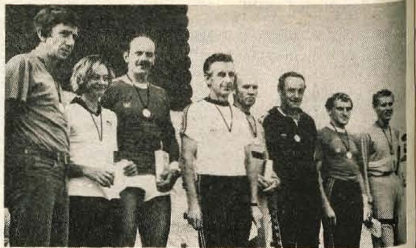
Tekači Partizana iz Kranja so zmagali v tekmovalni skupini štafet nad 300 let.

Strelci se zavedajo tudi slabosti v lastnih vrstah. Medtem ko dobro delajo veterani, bi želeli živahnejše delo z mladimi. Slednje bodo skušali izboljšati predvsem s širjenjem zanimanja za strelstvo v šolah.