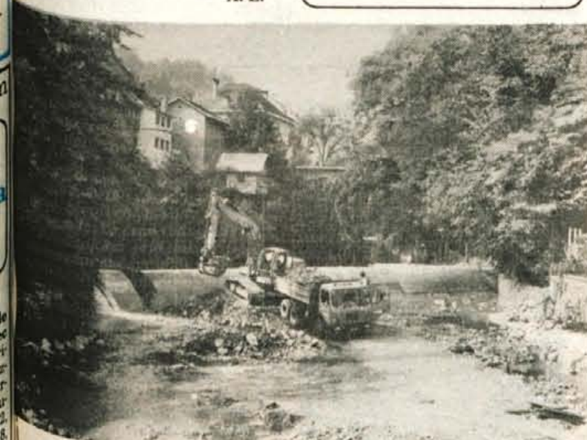
Skofja Loka — Delavci vodnogospodarskega podjetja iz Kranja obnavljajo šetrjev jez na Selški Sori. Denar za obnovo sta prispevala Območna vodna skupnost in Tovarna klobukov Sešir. Sešir naj bi na novem jezcu zgradil malo hidroelektrarno za pogon obrata na Spodnjem trgu. Tako naj bi jez spet služil prvotnemu namenu, saj je pred skoraj sto leti na tem mestu stala Krenjeva elektrarna.