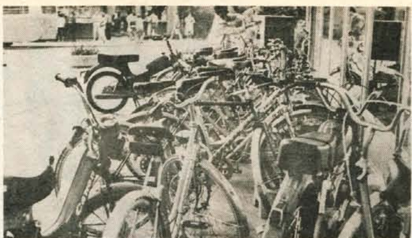
Največ koles v Kranju ukradejo na parkiriščih, kakršno je tole pred lekarno. Tam je največ izbire, med zaklenjenimi se najdejo tudi nezaklenjena kolesa, ki več ur ostajajo brez kakršnegakoli nadzora.

Kranj — V času, ko si vsakdo že ne more več privoščiti avtomobila, se je zelo razmahnilo kolesarstvo. Razpasel pa se je tudi tovrstni kriminal. V statistikah notranjih zadev je vsako leto več ukradenih koles. Seveda, nova, dobro ohranjena športna kolesa so danes vredna od 40 do 80 tisočakov. Spričo tega bi bilo logično, da lastniki dragih koles skrbno pazijo nanje, jih zaklepajo, kadar za hip skočijo v trgovino ali bife, ali jih vsaj znajo opisati, če jih pogrešijo. Vendar ni tako. Pred trgovinami, bloki, okrepčevalnicami, pred tovarnami in šolami se na parkiriščih grmadijo kolesa, mnoga med njimi nezaklenjena, druga zavarovana le s šibkimi ključavnicami na kombinacijo ali ključek, ki jih zna odkleniti vsak prvolec. Kadar kolo izgine, lastnik prijavi tatvino milici, pri tem pa običajno ve le za barvo kolesa.