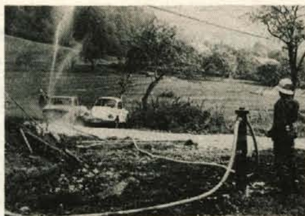
Voda iz vodovoda odpira nov list v razvoju vasi Gozd