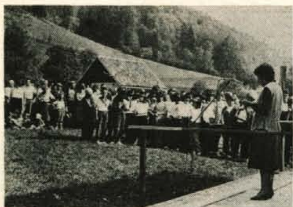
Na nedeljski svečanosti v Gozdu se je zbralo veliko ljudi