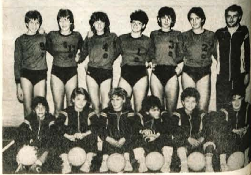
Odbojkarice Triglava, najmlajše moštvo v slovenskih odbojgarskih ligah.