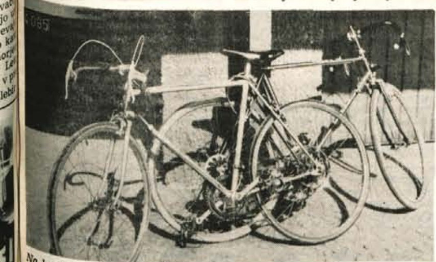
Na kranjski postaji milice imajo trenutno blizu 40 koles, ki jim še niso našli lastnika.

Uprava za notranje zadeve in Svet za preventivo in vzgojo v cestnem prometu sta lani izdala tako imenovane pomnilne lističe za kolesa. Nanje naj bi lastniki koles zapisali značilnosti svojega kolesa (tip, barvo, številko, posebne znake), da bi miličnikom olajšali delo pri iskanju ukradenih koles. Akcija je bila povsem neuspešna.