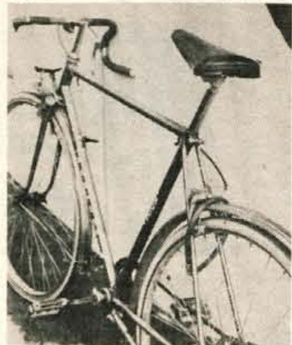
Zakaj izgine toliko zaklenjenih koles? Tudi zato, ker jih varujejo šibke ključavnice, ki jih je moč »odkleniti« že z navadnimi kleščami.

imenovanimi pomnilnimi lističi, na katere naj bi lastniki zapisali vse značilnosti svojega kolesa. Še tisti, ki so jim lističe razdelili, so jih najbrž zavrgli. Brez natančnega opisa pa je ukradeno kolo težko najti. Težko je tudi dokazati, da je neko kolo nezakonito zamenjalo lastnika, saj o lastništvu kolesa pričča le garancijski list. Vsako leto najdejo tudi številna kolesa, ki jim ne morejo najti lastnika. Ta odvzeta, pozabljena ali pa tudi ukradena kolesa pol leta ali leto dni čakajo na postaji molice, da jih pridejo lastniki iskat, nato se preselijo na občinski urad za najdene predmete, ki čez čas razpiše licitacijo. Kadar je ukradeno kolo, lastnika najprej povabijo, naj si ogleda zbirko najdenih koles, toda lastnik med njimi običajno ne prepozna svojega prevoznega sredstva.