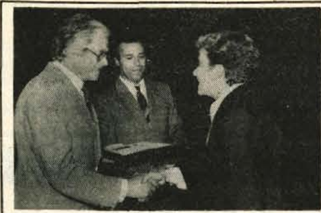
KRANJ — Na proslavi mednarodnega dne slušno prizadetih je republiško priznanje za uspešno 30-letno delo dobilo tudi gorenjsko društvo za slušno prizadete.