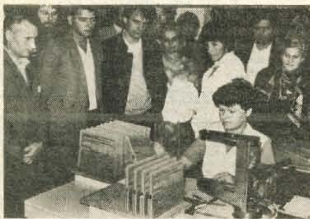
Med ogledom proizvodnje v Telematiki