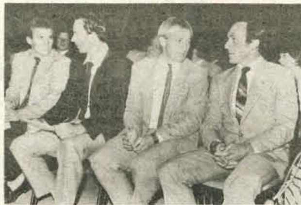
Elanove proslave seveda ne bi bilo brez Elanovih športnikov, prišli so tudi Bruno Kernen, Ingemar Stenmark, Bojan Križaj in Miro Cerar.