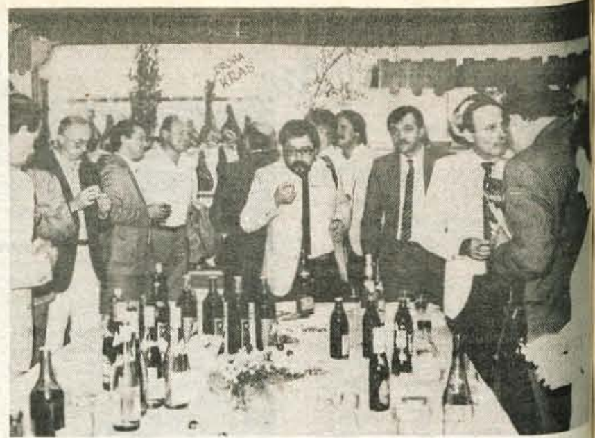
Poskusiti je treba, šele potem se lahko pravilno odločaš. Dobrotam, kakršnim v zadnjih letih ponujajo naše vinske kleti in pršutarne, se je težko upreti. Da bi se поблиže seznanili z našimi tovrstnimi proizvodi, je Murka iz Lesc na Šobcu pripravila pokušnji za koroške gostince in predstavnike slovenskih organizacij na Koroškem.