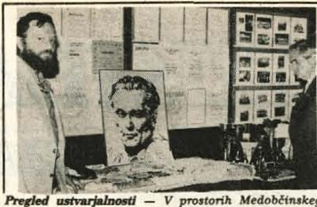
Pregled ustvarjalnosti — V prostorih Medobčinskega društva slušno prizadetih Kranj je te dni odprta razstava izdelkov, ki so jo pripravili člani v vse Gorenjske. Razstava je odprta v počastitev tridesetletnice obstoja gorenjskega društva. — Foto: F. Perdan