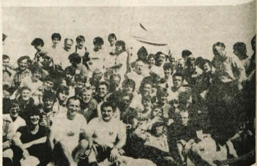
Z mladoporočencema so se veselili povabljeni in naključni gosti