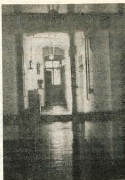
nejših vlog nedvomno igrajo socialne službe, ki pomagajo nekdanjim zapornikom storiti prvi korak v novo življenje

Zadnje čase tudi v radovljiškem zaporu nekaj obsojencev prestaja kazni v odprtih oddelkih. Tu vlada