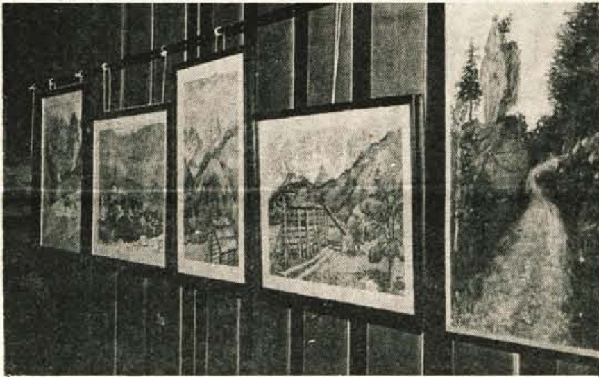
Razstava, vredna ogleda — V delovni organizaciji Donit v Medvodah je te dni na ogled prijetna razstava, s katero se predstavlja enajst avtorjev z ex tempora v Gozdu Martuljku. Ogled razstave je prijetno doživeti, saj so slike nastajale v prelepem okolju, čopič pa je sukala lju-bezen do slikarstva in veselja nad čudovito naravo. -fr