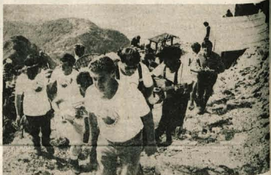
Doslej najsvetanejši vzpon od Gomiščkovega zavetišča na vrh Krna