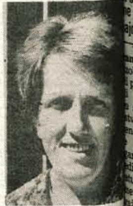
krajevni skupnosti Sovodenj za dodatne priključke, ki jih izkoristili. Ni nam treba plačevati, saj smo v Oselici

mož skupaj s sosedi, ki tu gori odločili za napeljavo telefona. Stara Oselica sodi v krajevno skupnost Trebija. Ker se je pri napeljavi telefona pokazala moč