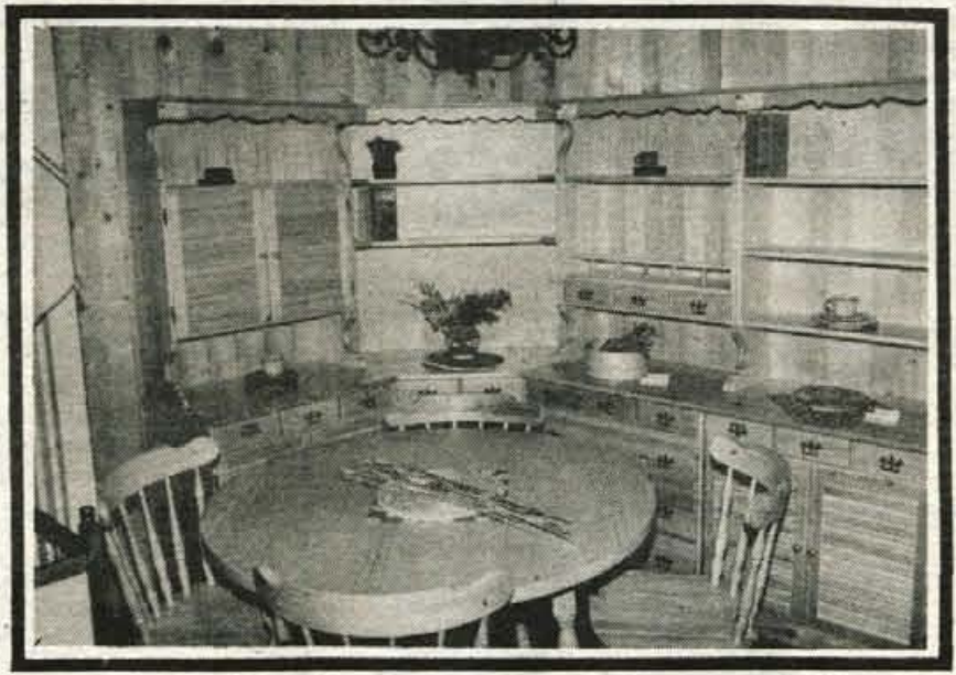
Izkoristite priložnost ugodnega nakupa! Salon bo odprt tudi na ŠUŠTARSKO NEDELJO!

V SALONU POHIŠTVA DETELJICA V BISTRICI PRI TRŽIČU RAZPRODAJA OPUŠČENIH PROGRAMOV IN VZORCEV MASIVNEGA POHIŠTVA od 29. 8. do 7. 9. 1985