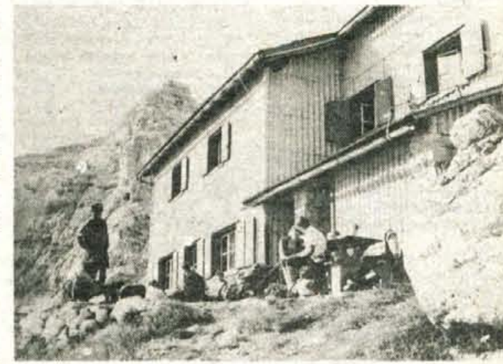
Za domom se najvišje dviga Razor, nova Križna pot pa vodi še na pet drugih bližnjih vrhov.