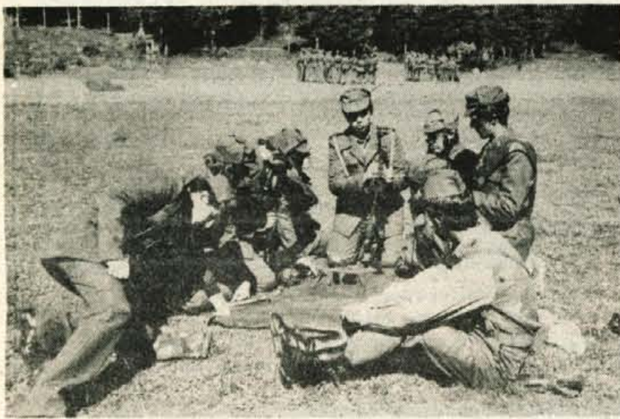
Razstavljanja in sestavljanja orožja se mladi nikoli ne naveličajo.