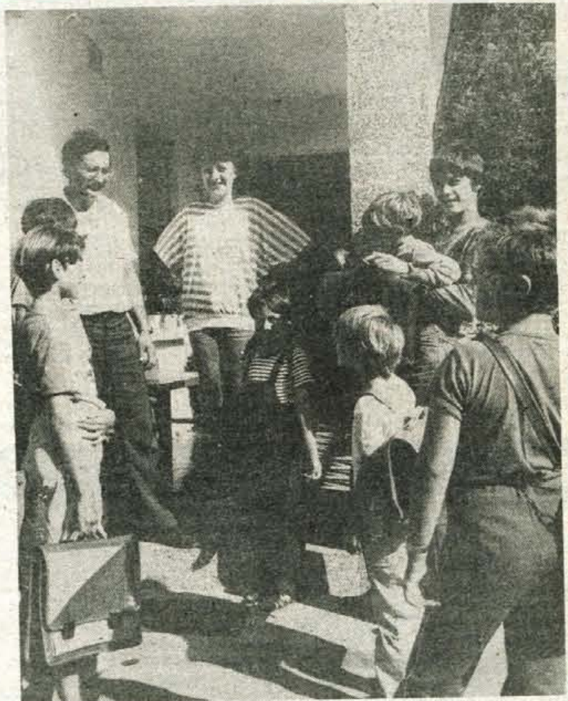
Zadnji počitniški dnevi se iztekajo, otroci imajo že vse pripravljeno za novo šolsko leto. Torbice so si včeraj nadeli za fotografiranje, v ponedeljek pa si jih bodo zares in za lep čas vzeli slovo od vedrih počitniških norčij.