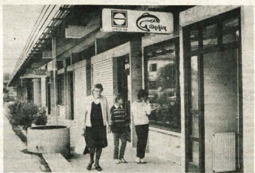
NOVO • NOVO • NOVO • NOVO Ribarnica odprta vsak delovni dan

Cenjene stranke obveščamo, da bomo našo RIBARNICO v Radovljici 5. septembra 1985 preselili v nove prodajne prostore v Cankarjevo ulico št. 62