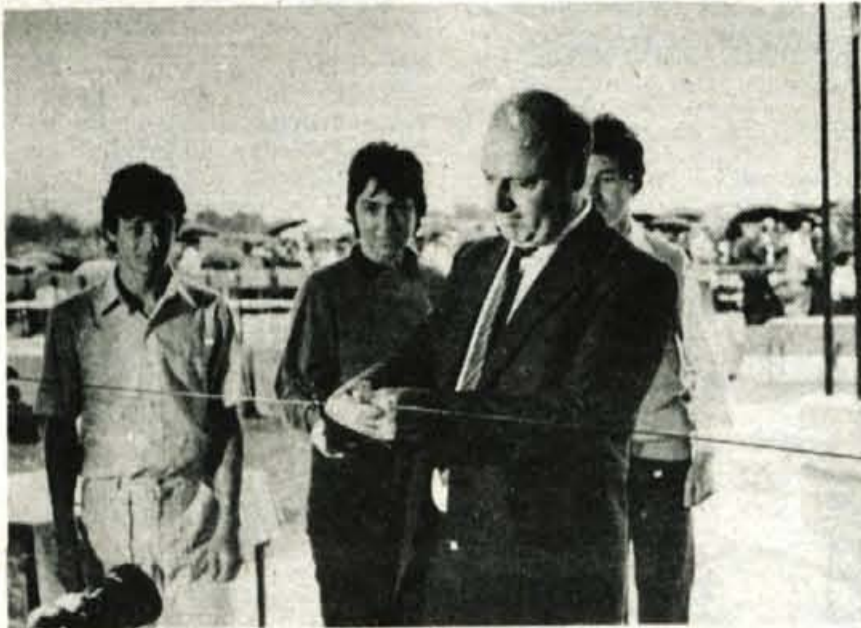
Predsednik republiškega izvršnega sveta Dušan Šinigoj je v petek slovesno odprl novo Iskrino šolo na Zlatem polju. — Foto: F. Perdan