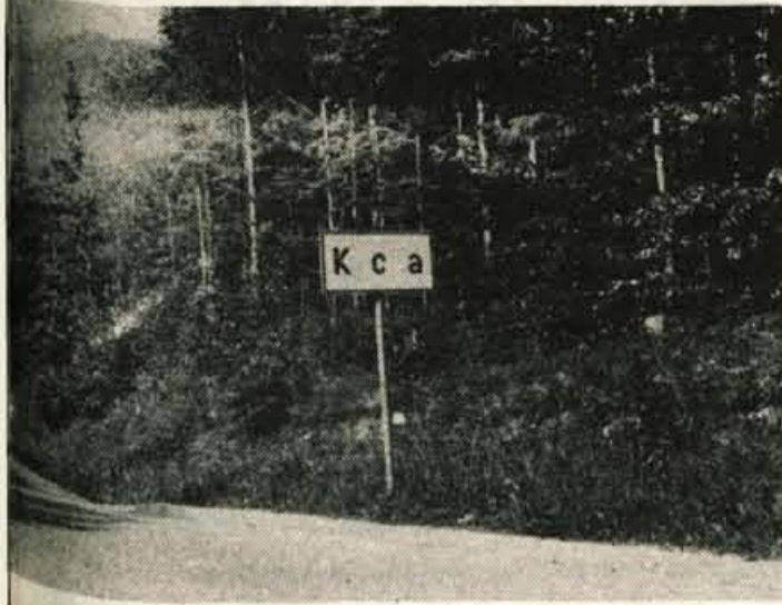
Kdo ve, kaj naj bi pomenila cestna napisna tabla? Tokrat so se tisti, ki so jim občestni napisi hudo napoti, lotili krajevnega napisu nadvse temeljito, tako da so zbrisali posamezne črke. Označba napoveduje kajo Kočno ali Poljane nad Jesenicami.