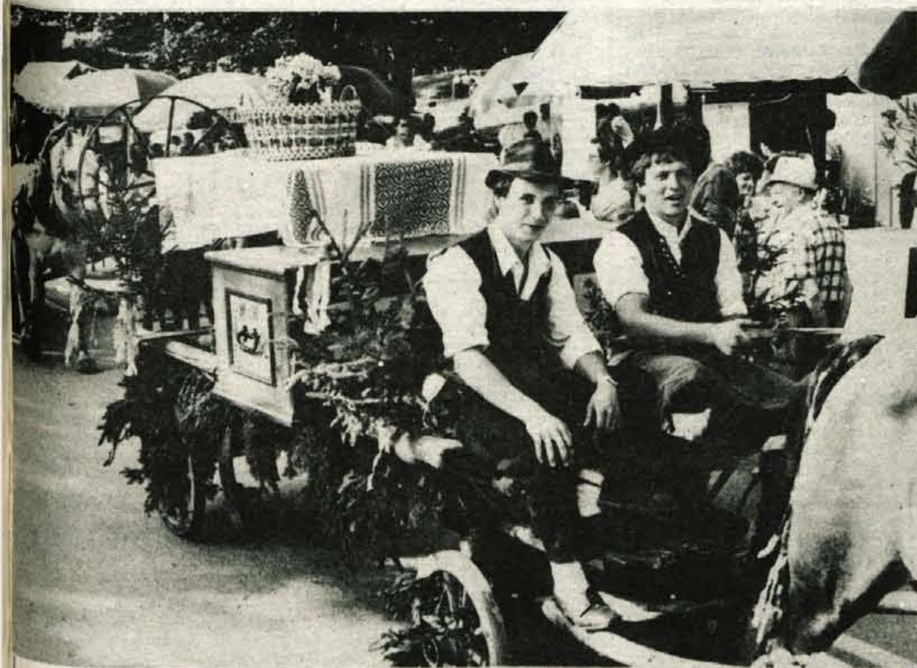
Minuli konec tedna sta turistično in kulturno umetniško društvo z Bleda spet pripravili privlačno turistično etnografsko prireditev, tradicionalno kmečko ohcet. Eden najimenitnejših ženitvenih običajev, prevoz bale, ki so jo na poti pričakali »šrangarji«, je v soboto na Bled privabil tisoče obiskovalcev od blizu in daleč.

GLASILO SOCIALISTIČNE ZVEZE DELOVNEGA LJUDSTVA ZA GORENJSKO