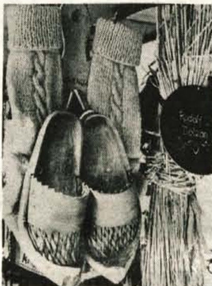
Med najprivlačnejšimi spoinki na blejskih stojnicah so bile lesene cokle Žirovničana Rudolfa Dolžana. Škoda, ker ni bilo še več tako izvirnih!