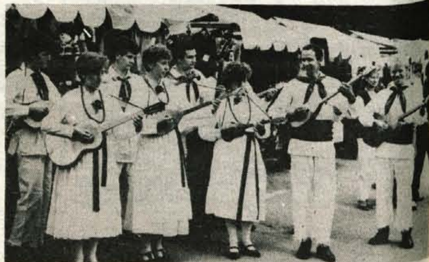
Tamburaški oktet Bisernica iz Reteč je ubral nekaj domačih melodij.