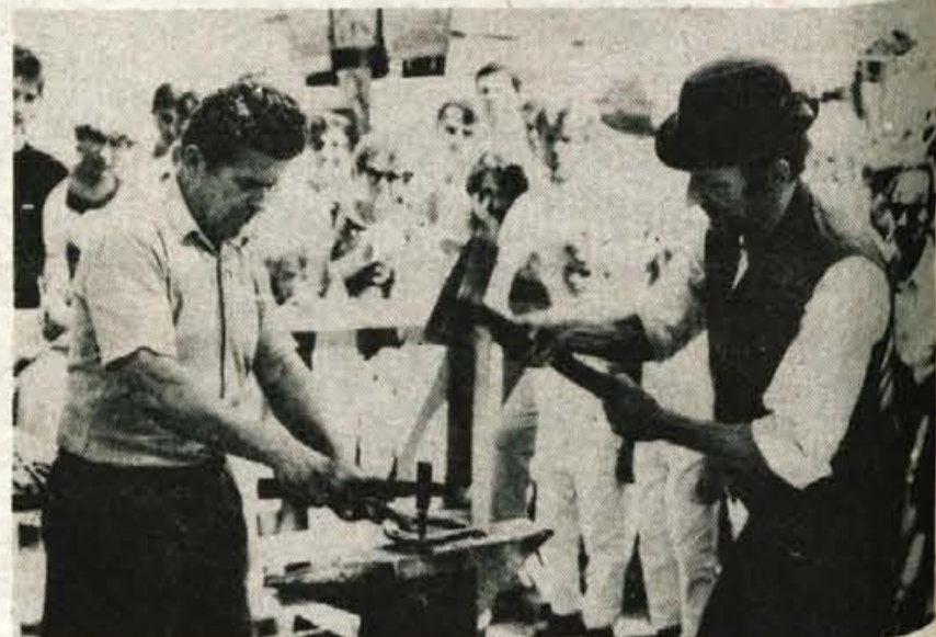
Kovača sta pred očmi radovednežev skovala lično podkev.