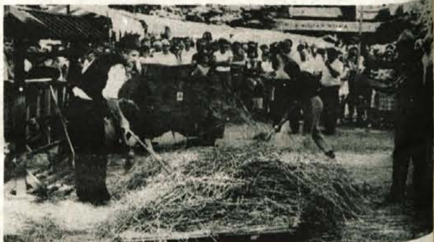
Ob kmečki ohceti so organizatorji prikazali nekaj zanimivih kmečkih opravil, ki jih danes ni več videti.