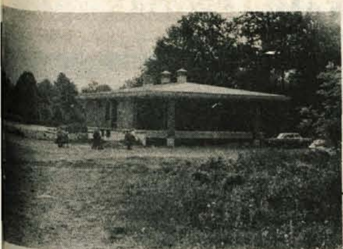
Se vedno samo v planu — Jeseniška komunalna skupnost naj bi letos končno le namenila denar za dokončno izgradnjo objekta na pokopališču na Blejski Dobravi, saj zanj vsako leto zmanjka denarja. Pokopališče na Blejski Dobravi se vedno bolj širi, obišče ga veliko ljudi, ki pa, žal, tu ne morejo kupiti ne sveč ne rož...