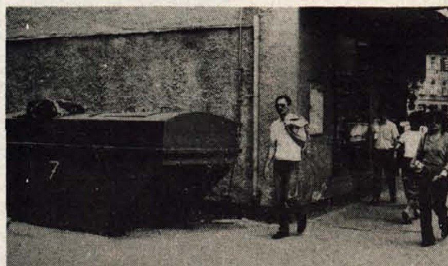
Iz kontejnerja smrdi — Mimoidoči Kranjčani si zatiskajo nosove, saj iz kontejnerja, parkiranega med Globusom in poslovalnico Kompassa, že nekaj časa neznansko zaudarja. Komunalci kljub nekajkratnim prošnjam, ki jih po telefonu sporočajo iz bližnjega Globusa, smrdi »sedmice« ne odpeljejo. Morda čakajo, da bo iz kontejnerja zadušilo?