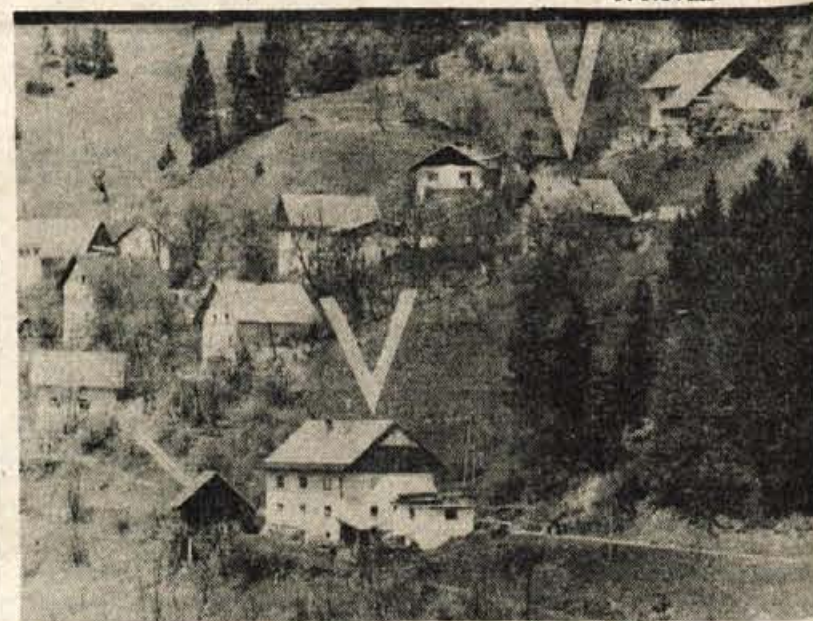
Hiši Dražgoše 52 in 56 bodo morali porušiti.