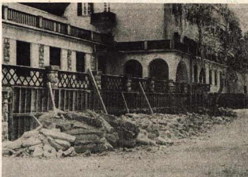
Najlepša vrtna terasa starega hotela Špik v Gozd Martuljku je pokazala pogubne razpoke in opozorila, da se bo zdaj zdaj podrla. In res se je, tako da je zdaj treba zgraditi nov oporni zid in še do letne sezone na teraso postaviti mize in stole.

Vendar so se odločili za obnovo, ki je do zdaj vzela že kar lepe denarce. Uspeli so temeljito adaptirati B trakt hotela, osrednji del in sobe preurediti vsaj v B kategorijo. Po hotelu je napeljana centralna kurjava, ostanejo pa še zahtevna dela, zlasti elektroinstalacije in vse ostalo skupaj z velikim objektom Mladin-