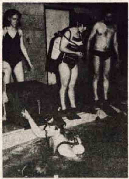
Zadnja navodila za pravilno opremljanje pred skokom v vodo

Nikar ne mislite, da je šlo za navadno čofotanje ali plavanje kar tako! Vsak gib je bil premišljen in voden; ne le prejšnji četrtek, ampak vsak četrtek od 18. aprila, ko se je začel praktični del potapljaškega tečaja.