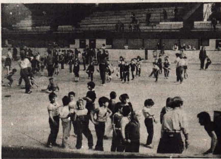
Cicibanova olimpiada — Vsako leto je dan mladosti v jeseniški občini bogatejši še za prikupne nastope najmlajših, ki obiskujejo vrte. Prizadene vzgojiteljice pripravijo malčke za skupen nastop, kjer pokažejo staršem, kaj so se naučili. Otroci vadijo, preskakujejo ovire, pokažejo igre z žogami, vse pa poteka tako, kot prava mala olimpiada. Letos so jo pripravili minulo soboto dopoldne v dvorani pod Mežakljo. — Foto: D. Sedej