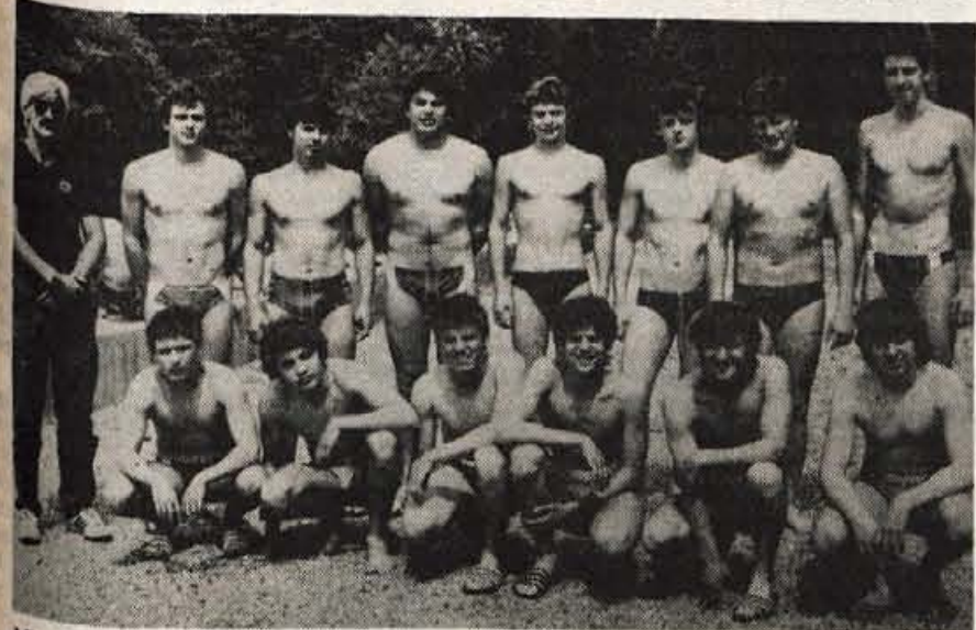
Mladinsko vaterpolsko moštvo Triglava je v finalu pokala SFRJ osvojilo šesto mesto.