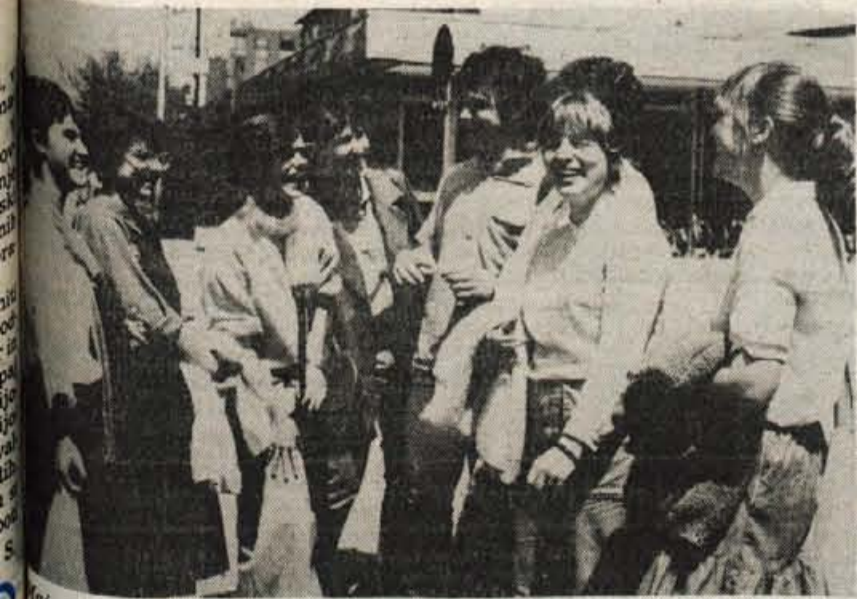
... mladost, igrivost, veselost...

Jutri bo otvoritev razstave mineralov in fosilov v Tržiču. Več o razstavi na 7. strani