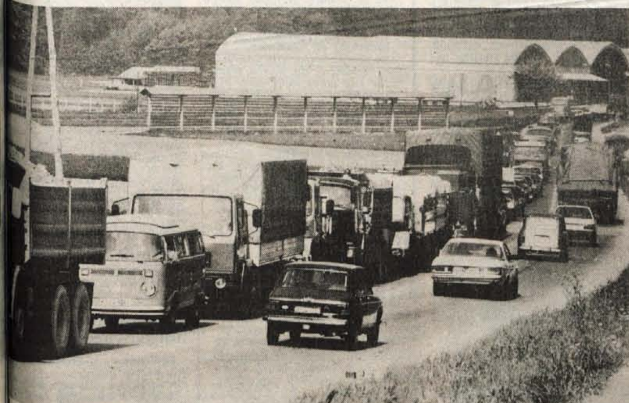
Nepričakovan »zamašek« na magistralki — Sredi tega tedna so se na magistralni cesti na Polici pri Kranju začela za voznike neprijetna presenečenja zaradi izmeničnega enosmernega prometa s semaforom urejanjem. Včeraj (četrtak) pa je iz presenečenja nastal nepričakovan »zamašek«, saj so se kolone čakajočih z obeh strani razvlekle na nekaj kilometrov. Vzrok je znan: urejanje magistralnega križišča na Polici, iz katerega se bo po izgradnji moč vključiti na avtocesto. Kaže pa, da so se usteli tisti, ki so dolžni skrbeti za čim bolj nemoten promet na magistralni cesti. Če ni bilo moč med sedanji deli poskrbeti za obvoz (?), bi morda veljalo razmisliti, da bi dela organizirali takrat, ko je najmanj prometa. Zakaj pa ne morda ponoči?! — A. Ž.

GLASILO SOCIALISTIČNE ZVEZE DELOVNEGA LJUDSTVA ZA GORENJSKO