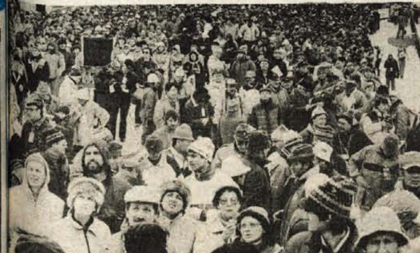
Vse dni je bilo pod Poncami pravo zimskošportno praznično vzdušje. V treh dneh poletov je Planico obiskalo nad stopenjdeset tisoč ljubiteljev smučskih poletov. Vsi so bili navdušeni nad organizacijo prvenstva in izvrstnimi poleti vseh nastopajočih.