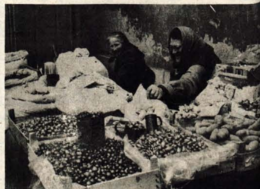
Semena na kranjski tržnici obetajo skorajšnjo pomlad.