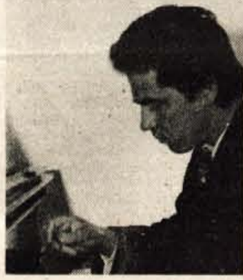
pianist Igor Dekleva