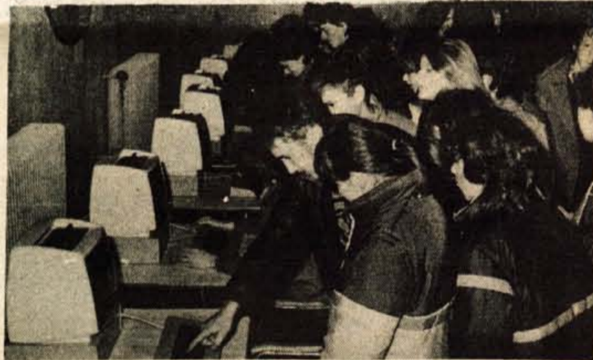
Računalniški dnevi 84 — Avlo Skupščine občine v Kranju od večeraj obiskujejo kranjski sedmošolci in osmošolci ter njihovi učitelji. Tam se namreč tri dni — začeli so se večeraj ob devetih, končani pa bodo jutri ob dveh popoldne — odvijajo računalniški dnevi, ki sta jih pripravila Elektrotehniško društvo in Občinska zveza organizacij za tehnično kulturo iz Kranja. Pokroviteljstvo nad dnevi je prevzela občinska raziskovalna skupnost.