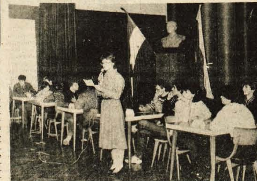
Kranj — Mladinska organizacija iz krajevne skupnosti Zlato polje v Kranju je minuli petek priredila kviz v počastitev bližnjega praznika naših oboroženih sil. Na njem se je v kranjskem domu armade zbralo šest ekip, ki so pomerile svoje znanje v poznavanju dogodkov iz NOB, statuta krajevne skupnosti in vojaških veščin. Prvo mesto in prehodni pokal krajevne skupnosti Zlato polje je osvojila ekipa iz kranjske rojstnice, na drugo mesto so se uvrstili tekmovalci kluba ZN v osnovni šoli France Prešeren, na tretje pa prva mladinska ekipa z Zlatega polja. (S)

Radovljica — Občinski odbor ZZB NOV obvešča občane, mladino, borce in aktiviste OF, da bo jutri, 15. decembra ob 12. uri svečanost v spomin na zmago mrtvega bataljona na Gorenjski na Pokljuki. Za avtobusni prevoz s Bleda na Pokljuko bo poskrbel Alpetour, avtobusi pa bodo odpeljali od 9.15 in od 10.30.