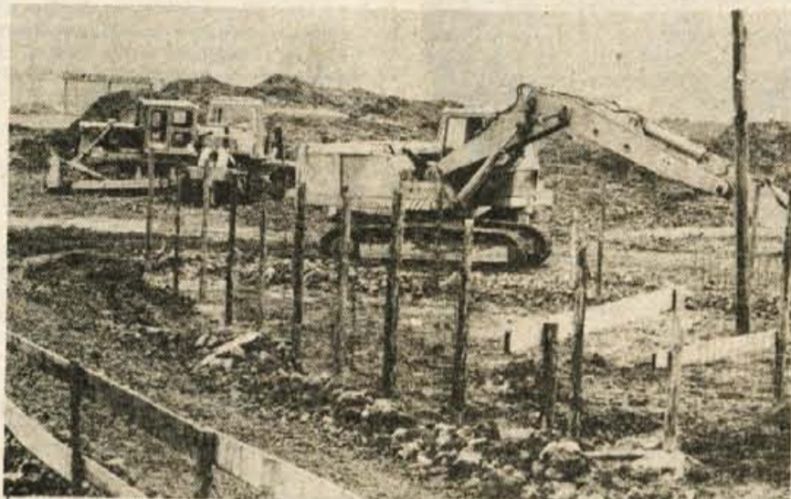
Gradnja jeklarne na Beli — Pri gradnji elektrojeklarne dela nekoliko kasnijo. Največ dela so imeli pri izbiri projektantov dobaviteljev domače opreme in izvajalcev montažnih del. V Sloveniji so namreč zahtevali dodatno preverjanje sposobnosti organizacij, ki bodo jeklarne gradila. Zato so lahko šele dva meseca po prijavi naložbe podpisali pogodbo s poslovno skupnostjo Rudis Trbovlje.