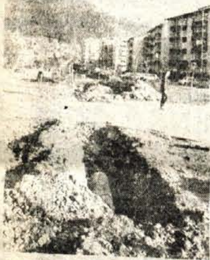
Med nedavnim obiskom delovne skupine centralnega komiteja ZKS v krajevni skupnosti so v razgovoru z nezadovoljstvom omenjali sedanje razkopavanje zelenic, prostora, ki so ga zasadili z drevesi pred dvema letoma. Še posebnost kritični so bili zato, ker jim nihče ni vnaprej pojasnil, čemu razkopavanje služi.