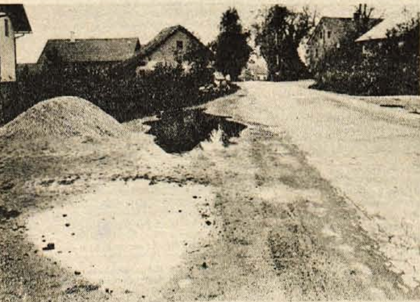
Avtobusno postajališče - Po Skofješki cesti v Strazišču pri Kranju vozi precej avtobusov. Medtem ko so druga postajališča kakor toliko urejena, je tole (na sliki) v smeri proti Kranju že čelo leta neurejeno in bolj podobno gradbišču...