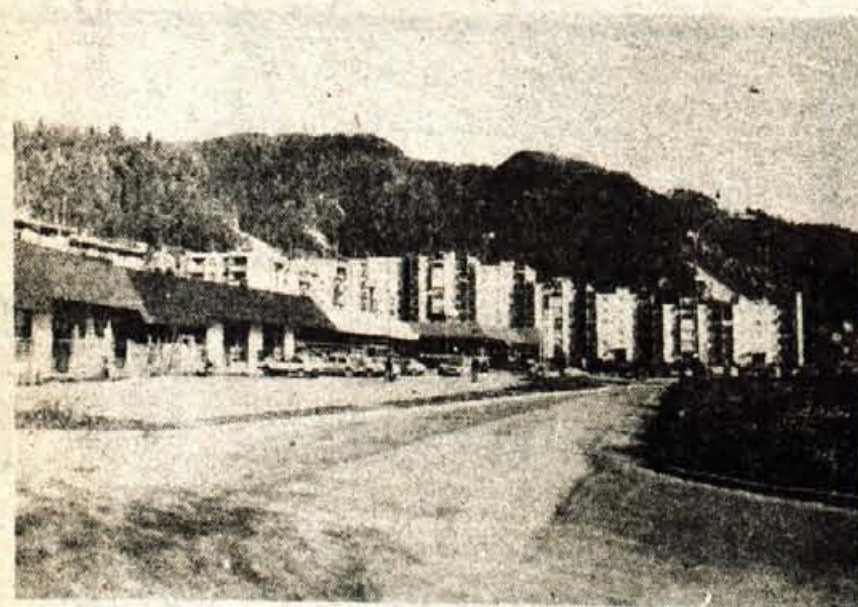
Pred sedmimi leti je bil novejši del krajevne skupnosti Bistrica še spalno naselje. Danes je ta krajevna skupnost med najbolj urejenimi v občini.