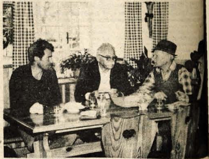
Zapisovanje pogovora pri Marenkovcu nad Zalo.