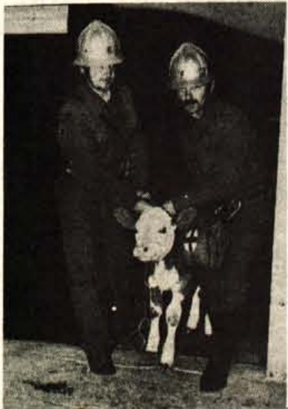
Zvirče: gasilska vaja ob mesecu požarne varnosti — V četrtek nekaj po peti uri popoldne je na Devovi kmetiji v Zvirčah izbruhnil požar. Ognjeni zublji so zajeli dobro založeni senik in hlev. Obstaja nevarnost, da se požar razširi tudi na sosednje objekte, se je glasil načrt za gasilsko akcijo, ki so jo v mesecu požarne varnosti pripravili člani Gasilskega društva Kovor in domačega gasilskega oddelka civilne zaščite. Klicu na pomoč se je odzvalo skupno 20 gasilcev, ki so z vodo iz bližnjega protipožarnega bazena in vodovodnega omrežja v izurjeni vaji omejili namišljeni požar in spravili živino iz hleva na varno. Od znaka za začetek vaje do takrat, ko so v ognjene zublje uperili še zadnjega izmed treh vodnih curkov, je minilo vsega deset minut. — C. Zaplotnik