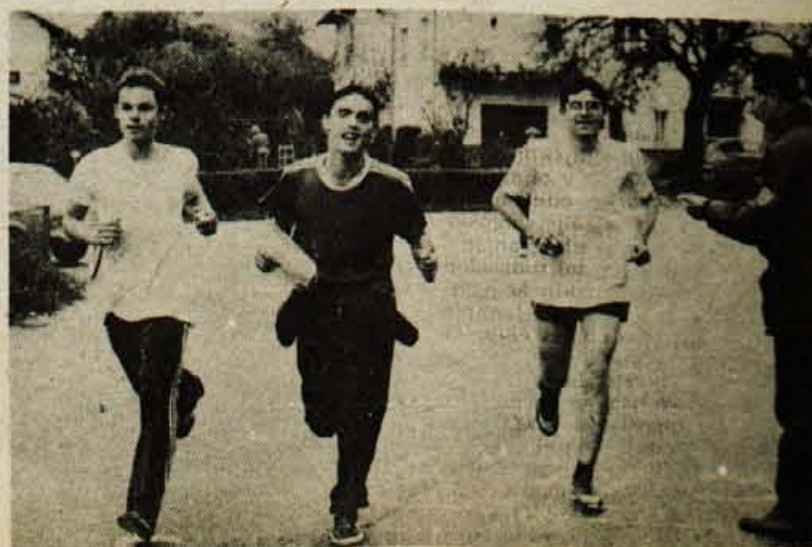
Vojaki Vojne pošte 1098/30 Škofja Loka — članski zmagovalci 9. ekipnega orientacijskega teka za Pokal Kranja.