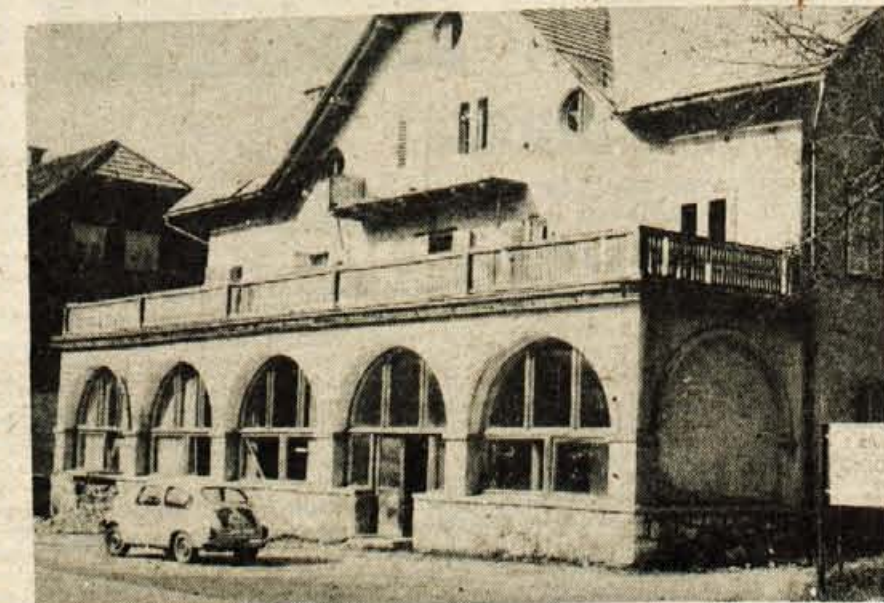
Jezerki Korotan je tik pred rušenjem