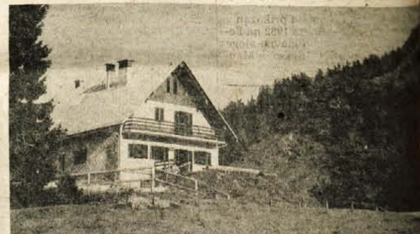
Koča pod Blegošem (1391 m). Na desni vrh Blegoša (1563 m)

In tako sem se spet zaklepeta! Namesto, da bi opozoril, kako se je smrekovim in jelovim sestošem, ki gospodu-