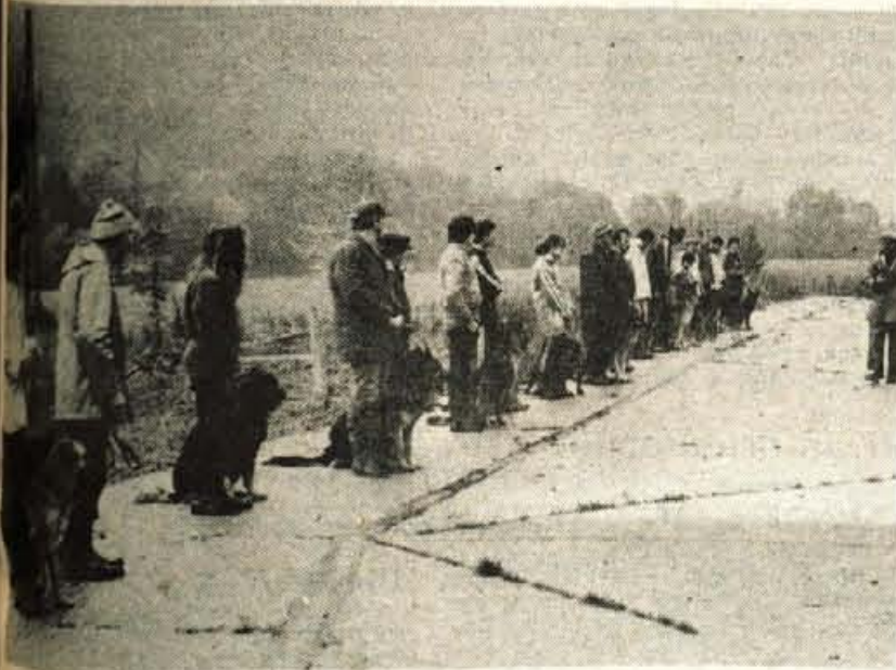
Šolan pasem so imeli najbolj množično zastopstvo na izpitu nemški ovčarji, najbolj univerzalni psi. Tudi domači kraški ovčar je vsestransko uporaben, le lajati ga je treba skrbneje kot nemškega.