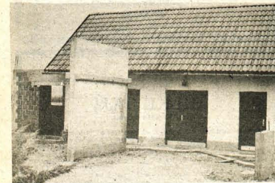
Predoslje — Krajan Predoselj se že nekaj časa sprašuje, kdaj bodo dokončane mrtiške vežice na pokopališču, ki ga uporabljata dve krajevni skupnosti. Obnova in razširitev vežice je bila predvidena že do julija, upali so sicer, da bo nato vsaj do krajevnega praznika, očitno pa bo trajalo še nekaj časa, da bo vse gotovo. Denar za obnovo so prispevali krajan, del pa je bil dodeljen iz združenih sredstev za krajevne skupnosti.