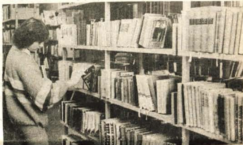
Mesec knjige — Oktobar je posvečen knjigi, kot že nekaj let doslej so ga naši založniki in knjigarnarji obeležili z 10-odstotnim znižanjem cen knjig. Žal resnični popust daje le Mladinska knjiga, saj so drugi založniki pred tem cene povišali.