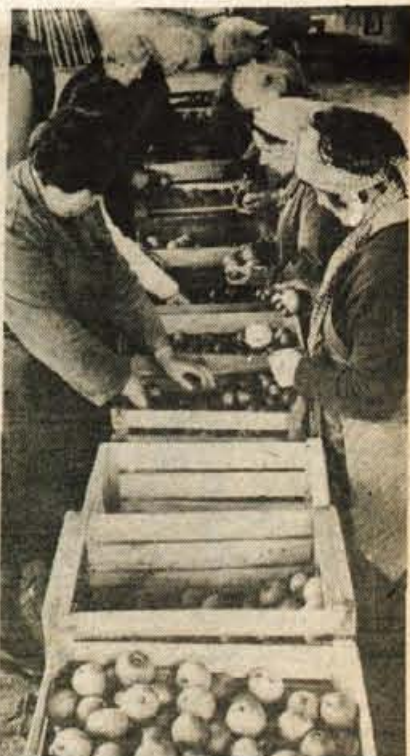
V največjem gorenjskem sadovnjaku v Resju pri Podvinu so v sredo začeli z obiranjem zgodnje sadja, v ponedeljek, če bo seveda lepo vreme, pa bodo prišli na vrsto še nasadi poznih sort. Pri spravilu sadja pomagajo delavcem Kmetijsko živilskega kombinata Gorenjske še upokojenci, gospodinjice in šolarji. Sindikalne organizacije bodo za kilogram prvovrstnega sadja odštele 42 dinarjev, za drugovrstno pa 30. V prodaji na drobno bodo jabolka nekoliko dražja, prva vrsta bo po 45 dinarjev, druga vrsta po 34, tretja vrsta, ki pa je primerna predvsem za predelavo, pa po 20 dinarjev.