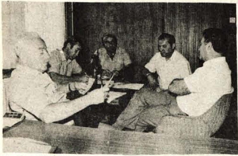
Predstavniki NK Triglav med pogovorom v uredništvu Glasa

Nogometiški kranjskega Triglava prvič zmagovalci tekovanja za pokal maršala Tita v Sloveniji