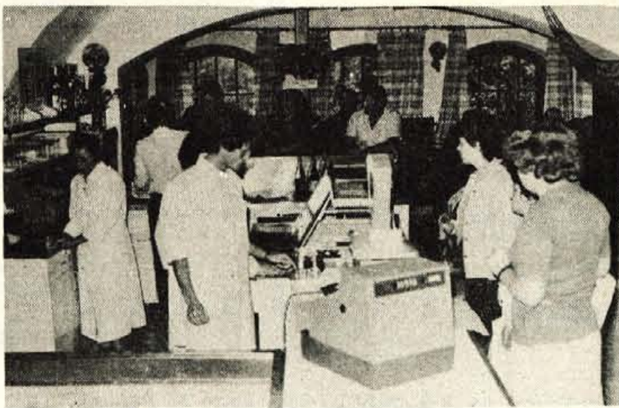
Ribarnica Delfin z bistrojem je bila že v prvih dneh zelo dobro obiskana.