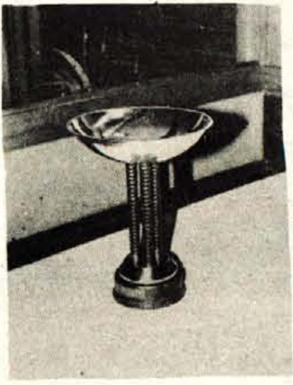
Dragocen pokal za zmago v pokalnem tekovanju za področje Slovenije

»S Partizanom bomo jutri igrali tako kot smo pretekli teden z Mariborom. Srčno, požrtvovalno in borbeno, čeprav se zavedamo, da je kvaliteta razlika med nami in Partizanom velika. Hočemo ponovno dokazati, da je Triglav moštvo dobrih nogometištev in da naš uspeh ni bil naključen,« so ob novici, da igrajo doma s Partiza-