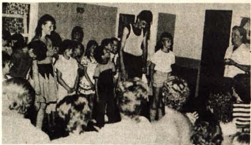
Skupina učencev iz Nagolda, ki je letovala skupaj z jeseniškimi vrstniki