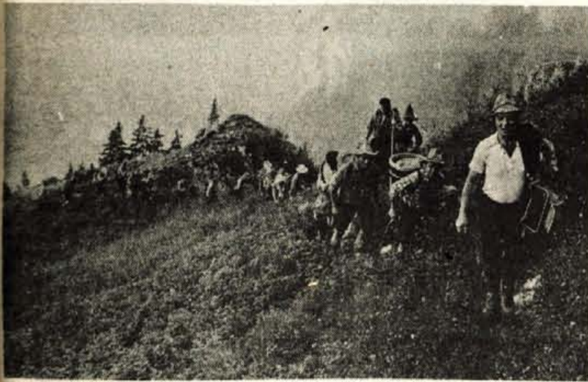
Med pohodom proti Prešernovi koči kljub kislemu vremenu ni zmanjkalo dobre volje

Rekreacijski klub večno mladih fantov iz Radovljice je minulo soboto priredil 10. pohod na Stol — Vedra prireditve ob razvitju klubskega prapora na radovljiškem Linhartovem trgu — Člane družita prijateljstvo in humor