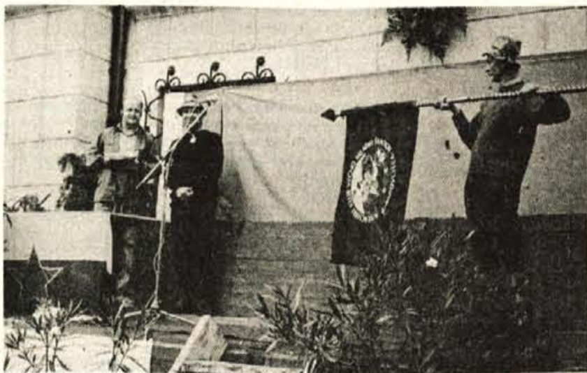
Odslej bo klubovce na vseh pohodih spremljal novi prapor

dil, a najprijetnejši so izleti z Večno mladimi. Ni mi žal, da sem se jim pridružil; po eni strani veliko pomeni zavest, da človek v poznih letih še ni za v staro šaro, po drugi strani pa tudi to, da se zna v družbi poveseliti.«