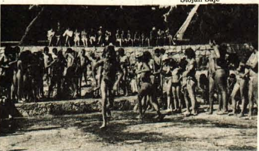
Razna šaljiva tekmovanja so pripravili v Novigradu. Med drugim tudi takšno, kdo bo prinesel iz morja na obalo v kozarcu največ vode

Začelo se je ob treh popoldan s svečanim sprevidom pohodnikov od parkirišča pri radovljiški avtobusni postaji do središča Linhartovega trga, kjer je vrle fante ob zvokih godbe pozdravljala množica