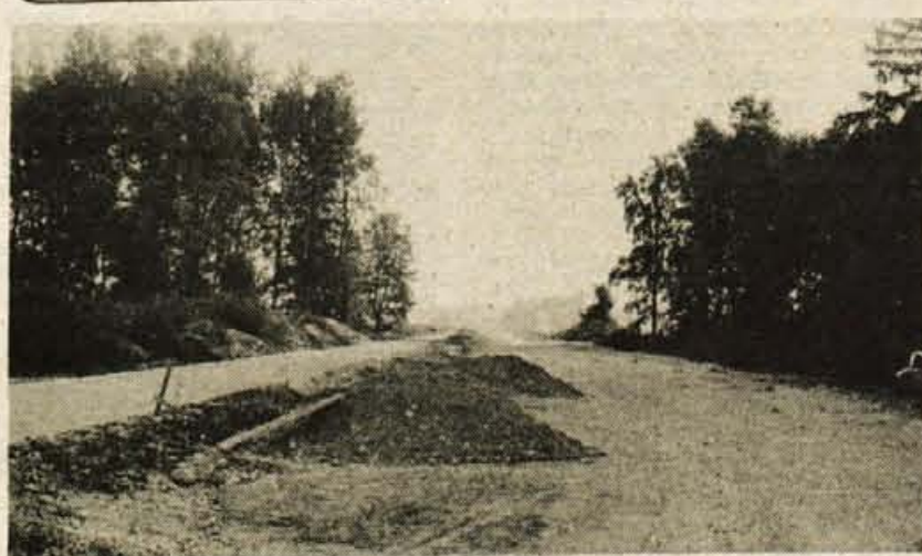
Predvidoma v drugi polovici prihodnjega meseca bodo položili asfalt na vzhodni obvoznici, sredi meseca pa naj bi se od priključka na brniško cesto začela tudi gradnja regionalne ceste do Britofa.

Bled — Strokovni svet jugoslovanske veslaške zveze je določil kandidate za nastop na balkanskem veslaškem prvenstvu, ki bo 15. in 16. septembra v Bukarešti. Med kandidati sta tudi dva blejska čolna: članski dvojec brez krmarja in mladinski četverec brez krmarja. Kandidati za nastop na veslaški balkaniadi bodo morali norme še enkrat potrditi na bližnji regati na Adi Ciganliji v Beogradu.