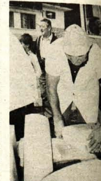
Največ dela so poleg harmonikarjev imeli Bohinjci, saj so sproti rezali sir za številne ljubitelje te bohinjske dobrote.