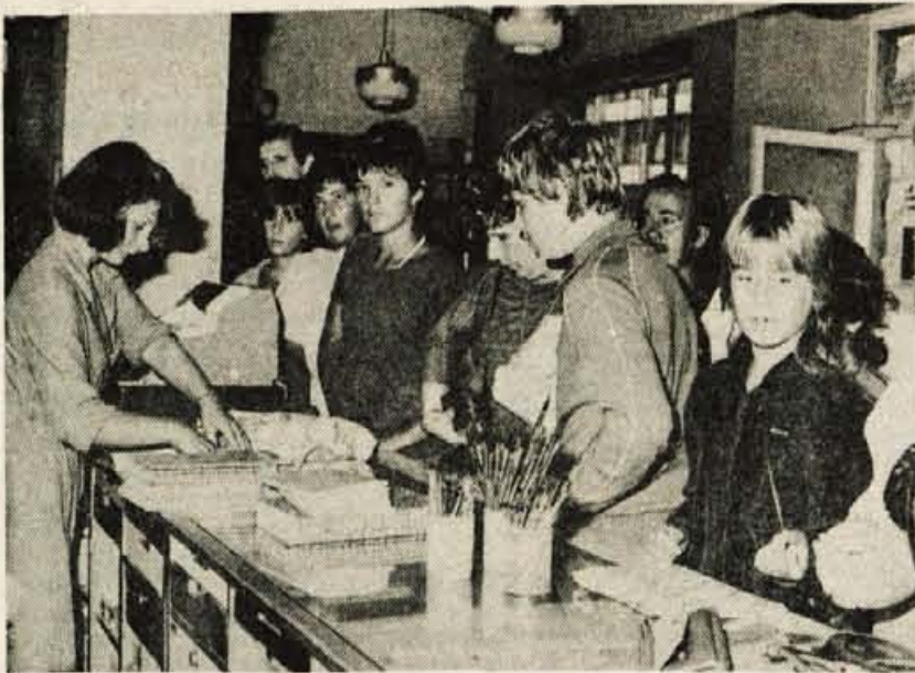
Kranj — Še nekaj dni in počitnic bo konec. Učenci in dijaki, pa tudi starši, imajo že sedaj dosti dela. Treba je nakupiti knjige, zvezke, svinčnike in druge šolske potrebščine. Zato imajo te dni prav prodajalke v knjigarnah največ dela.

Radovljica — Muzeje v radovljiški dolini je v letošnjem prvem polletju obiskalo 38.412 ljudi, kar je dober odstotek več kot lani v lanskem prvem polletju. Obisk je bil torej dober, kar predvsem zaradi veliko večjega števila obiskovalcev v Čebelarnem muzeju v Radovljici, kjer so obiskali 8.458 domačih in tujih obiskovalcev, kar je dobro tretjino več kot lani. V drugih muzejih je obisk ostal enak; Kovaški muzej v Kropi si je pridobil 6.866 ljudi, Muzej talcev v Zgodovinski muzej v Trzinu pa 6.320. V junjah 18.094 in Muzej Tomaža in družine v Bohinjski Bistrici le 703. Pojavlja se torej vse dražji prevoz in obisk izletniških, zlasti šolskih skupin. Obisk muzejev v radovljiški dolini pa se julija in avgusta krepko poveča, saj jih obiščejo številni turisti.